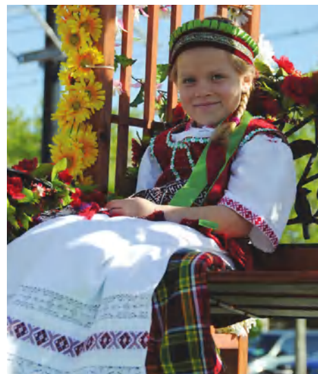
Pagrindinės vertybės vaikuose pasėjamos šeimoje

kartais ne, bet klaidos padėdavo rasti tinkamus sprendimus. Taip bus ir dabartinei jaunajai kartai. Bėda ta, kad jie palieka Tėvynę, neradę čia darbo, savo vietos. Ir tada jiems gimtoji kalba lieka antroje vietoje. Jie kalba tos šalies, kurioje gyvena, kalba. Bet, reikia tikėtis, tai laikina.