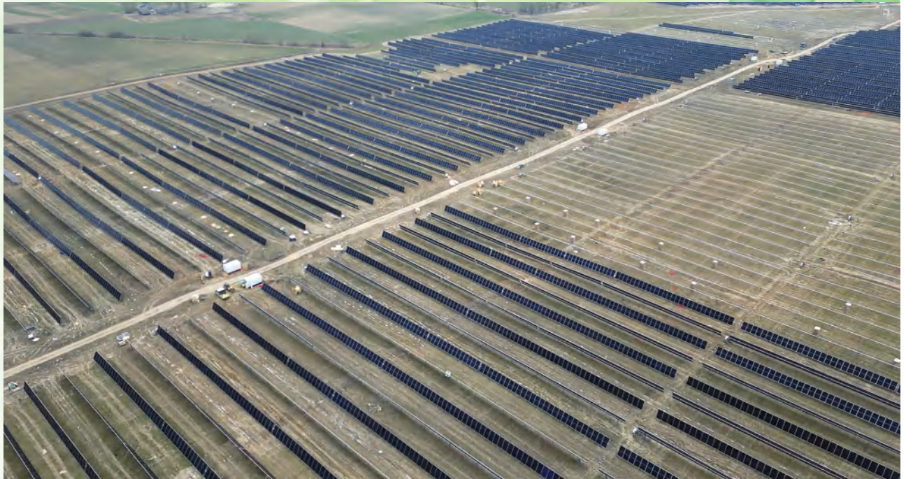
Saulės elektrinių parkas Narto kaime užims 86 ha plotą

Saulės parkas leis sumažinti išmetamo CO 2 kiekį iki 26 000 tonų per metus, kas prilygsta maždaug 10 000 automobilių išmetamam CO 2 kiekiui. Tokiu būdu projektas padės Lietuvai siekti ES klimato neutralumo tikslų ir pereiti prie tvaresnės energijos gamybos. Saulės energija yra švari ir atsinaujinanti, todėl elektrinė prisidės prie priklausomybės nuo iškastinio kuro mažinimo.