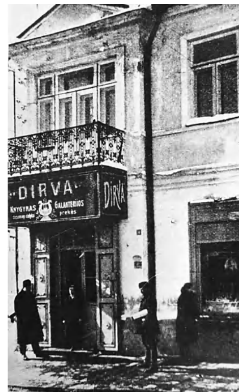
„Dirvos“ bendrovės knygynas Marijampolėje, J. Basanavičiaus aikštėje

Per 1919–1937 m. bendrovė išleido 500 pavadinimų knygų daugiau kaip dvi milijonų tiražu. Ypač populiariu Marijampolėje tapo laikraštis „Suvalkų kraštas“. Prieš pat karą knygyno bibliotekoje jau buvo sukaupta apie 1100 knygų ir užregistruoti 162 skaitytojai. Tai buvo vienintelė miesto skaitykla, kurioje leista skaityti ir visiškai naujas knygas. Be knygų, pardavinėjo ir paveikslus,