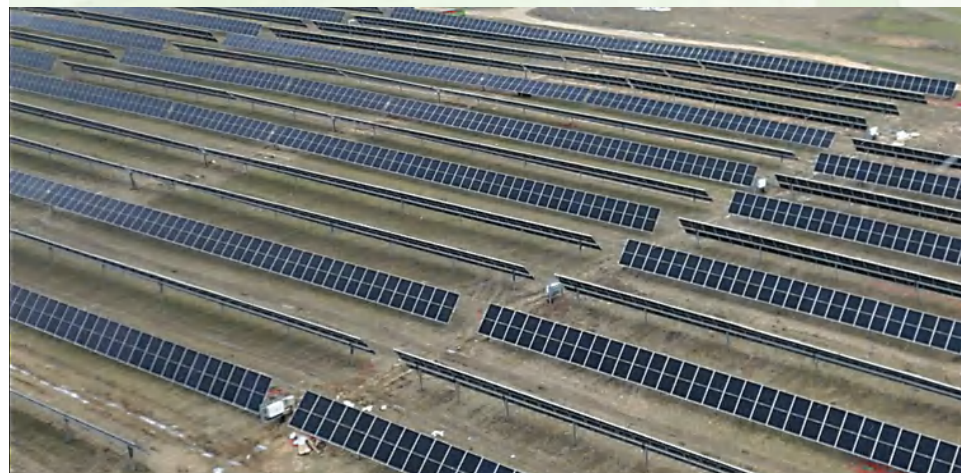
Sistema inovatyvi: moduliai keis pasvirimo kampą pagal saulės judėjimą

MW. Skaičiuojama, kad tai pagamins tiek elektros energijos, kiek užtektų apie 18 tūkst. vidutinių namų ūkių poreikiams aprūpinti. „Šią energiją savival-