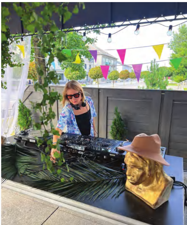
„Esu kūrybiškas žmogus: miksuju muziką ir esu mėgėja DJ“