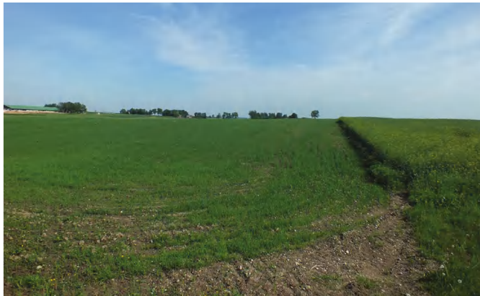
Buvusi Naujakaimio dvarvietės vieta

1887 m. pastatų sumažėjo iki 5, o gyventojų skaičius išliko toks pat. 1900 m. Novopolės dvaro žemės valda siekė 804 margus, savininkas laikė 32 arklius, 87 stambius ir 294 smulkius gyvulius. 1902 m. stovėjo 6 pastatai, kuriuose gyveno 68 žmonės.