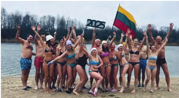
Marijampolės ruonių bendruomenė

Pasaulinę ruonių dieną – sausio 1-ąją – Marijampolės ruoniai sutiko bendruomeniškomis ledinėmis maudynėmis, kurios įvyko Marijampolės Marių parko salos plažėje.