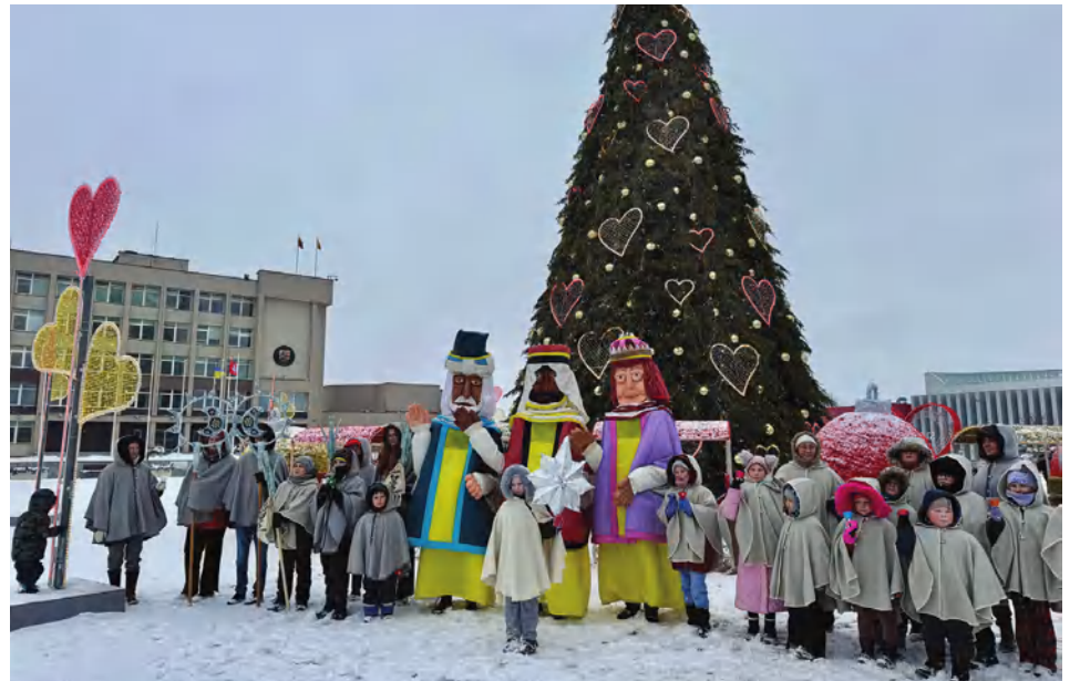
Tradicinė Trijų Karalių eisena Marijampolėje

Reiktų paminėti, kad anksčiau Trijų Karalių iškilmė bažnyčioje buvo švenčiama antrąjį sekmadienį po šventų Kalėdų. Tik nuo 2019 m., Dievo kulto ir sakramentų drausmės kongregacijai patenkinus prašymą leisti Lietuvoje kasmet švęsti Kristaus Apsireiškimo iškilmę sausio 6 dieną (nebekilnojant jos į sekmadienį), ši šventė minima tą savaitės dieną, kada ir būna sausio 6-oji. Tuo pačiu nuo tų metų šiai iškilmėi buvo suteiktas ir neprivalomos liturginės šventės rangas. O tai reiškia, kad dalyvauti šventose Mišiose – neprivaloma.