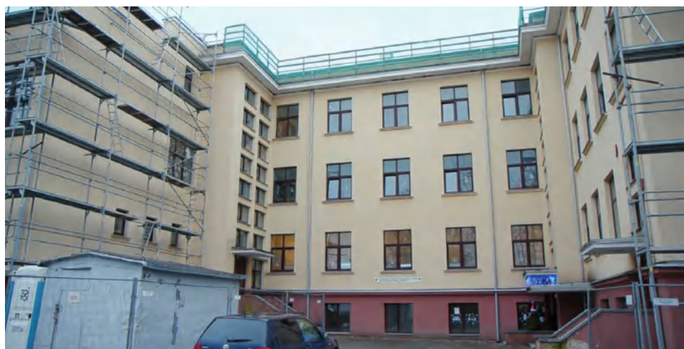
Skyrius remonto nematė nuo pat įkūrimo

Šiuo modernizacijos projektu siekiama užtikrinti senyvo amžiaus asmenų galimybę išlaikyti kuo didesnę savarankiškumą ir gyventi oriai.