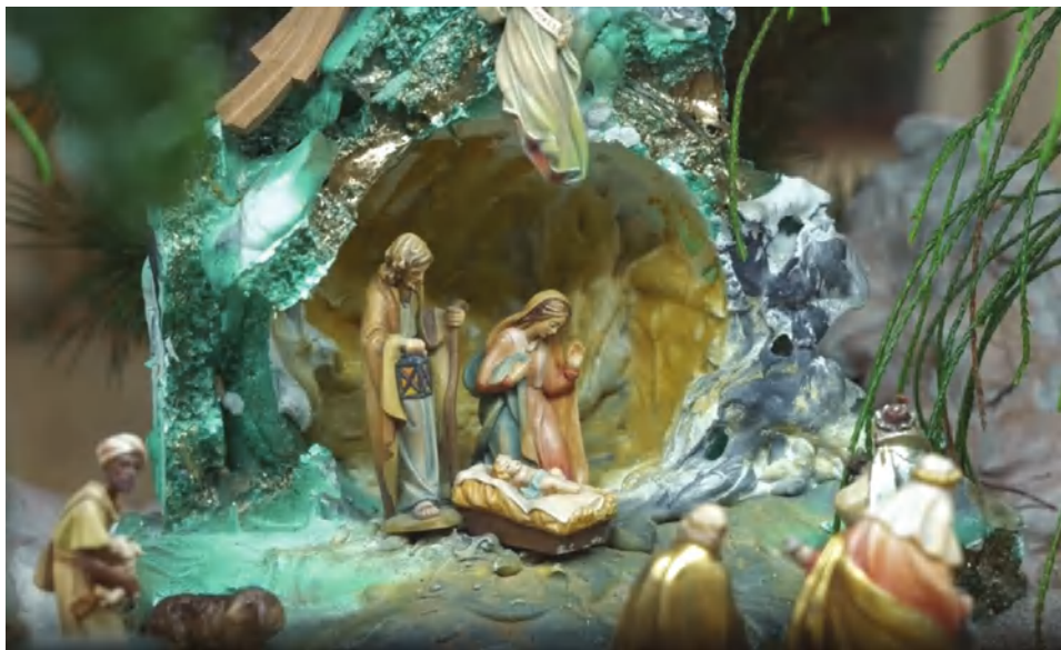
Prakartėlė Šv. Vincento Pauliečio bažnyčioje