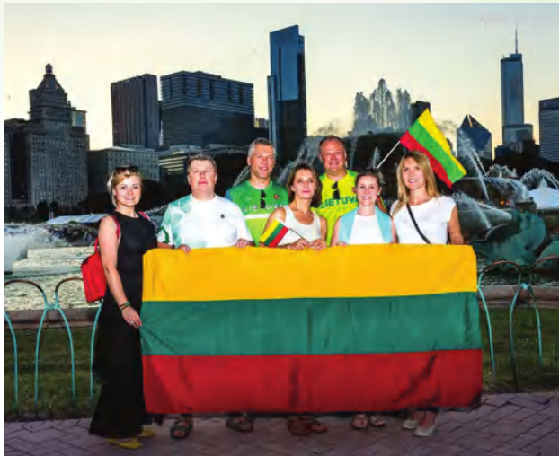
Liepos 6-osios minėjimas

Iš tikrųjų, amerikiečiams apskritai didesnė šventė yra ne Kalėdos, o Padėkos diena ( angl. Thanksgiving ). Amerikoje yra daug skirtingų religijų, tai yra ir žmonių, kurie Kalėdų nešvenčia. Įdomu tai, kad amerikiečiai švenčia tik pirmąją Kalėdų dieną, netgi darbas apmoka tik vieną dieną – Kalėdų. Čia nėra taip, kaip pas mus, Kūčių vakaro, kai nevalgome mėsos, o tik žuvį, silkę. Tokių tradicijų laikosi nebent imigrantai, pavyzdžiui, lenkai, lietuviai, tačiau grynakraujai amerikiečiai tokių tradicijų neturi.