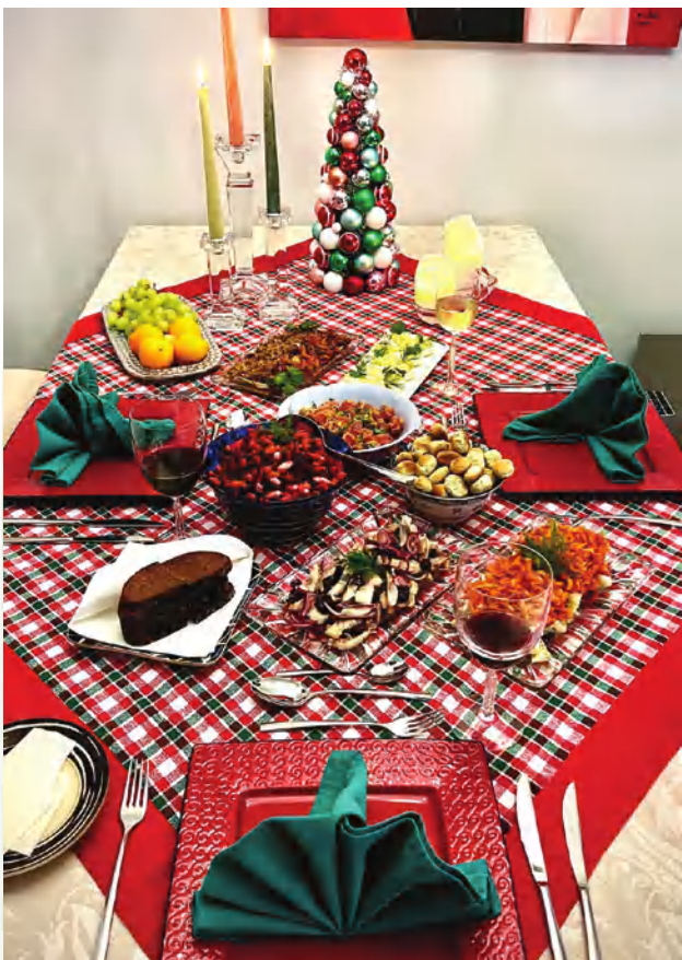
Šventinis stalas su draugais

Dabar jaunimas laisvai kalba angliškai. Kai aš išvažiavau į Ameriką, mano santykis su anglų kalba buvo labai sudėtingas ir reikėjo persilaužti ne tik kalbą, bet ir išmokti adaptuotis. Buvo daug tokių sunkių dienų ir laikotarpių, kai nebuvo pinigų, reikėjo įsitvirtinti pačioje Amerikoje, bet mano užsispyrimas ir ego neleido prašyti tėvų ar kažkieno pagalbos. Aš žinojau, kad galiu pati padaryti, atsistoti ant kojų ir, man atrodo, dauguma emigrantų išvažiavę turi tokį charakterio bruožą – išgyventi.