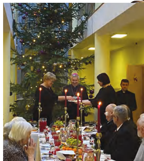
Šventės globos namuose – ne mažiau jaukios nei namuose