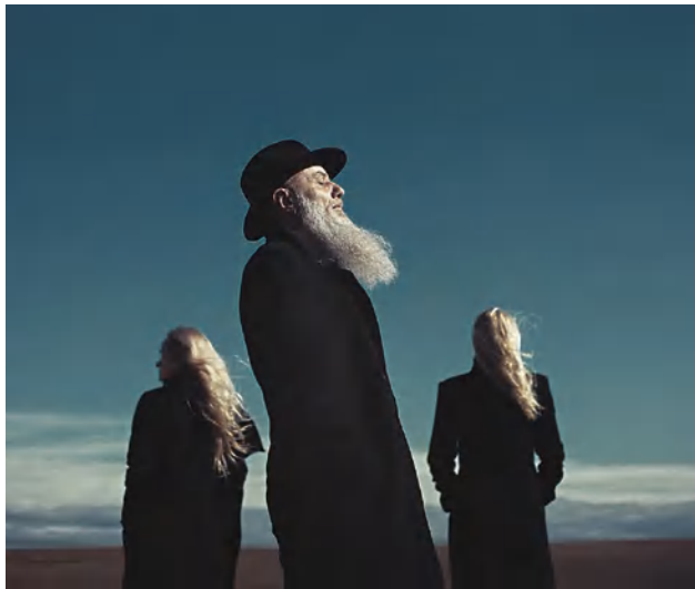
Iš ciklo „ILGESIAI“

„Kūrybinės mintys, idėjos man ateina savaime. Kartais įkvepia rūškanas rytas, kada tik dėl to vėluoji