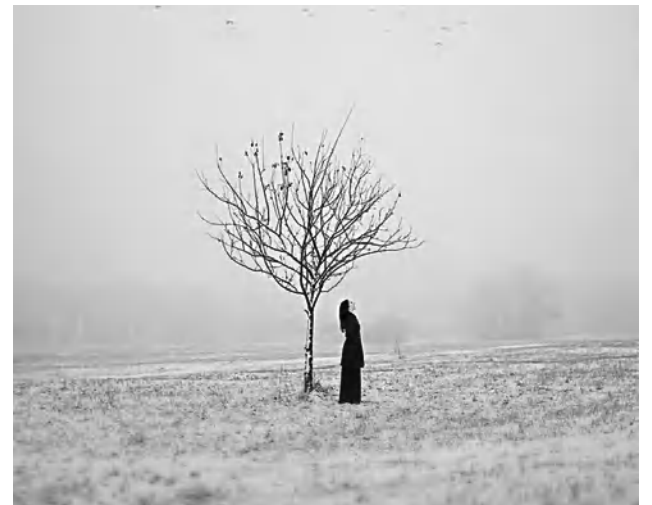
Iš ciklo „ILGESIAI“