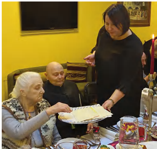
Šventės čia neatsiejamos nuo tradicijų