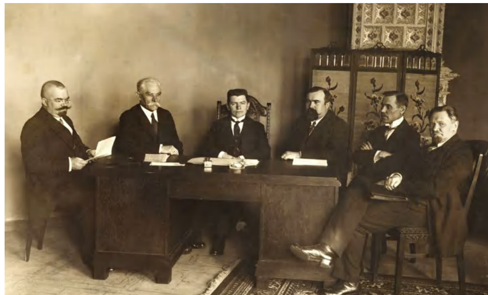
Pirmosios Lietuvos vyriausybės nuotrauka, 1918 m.; antras iš kairės – Petras Leonas

ras leisdavo tik Suvalkijoje. Pirmieji jo politikos, ekonomikos ar sociologijos temų straipsniai pasirodė 1887 metais „Lietuviškame balse“, vėliau – „Varpe“, „Šviesoje“, „Lietuvos ūkininke“; dažniausiai pasirašinėjo P. Liūto vardu.