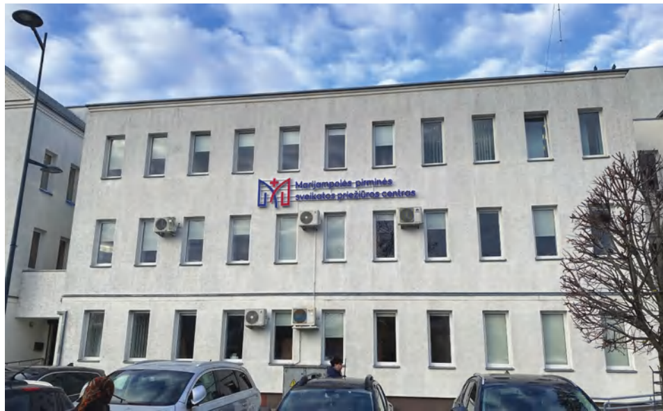
Marijampolės PSPC prasidėjus šaltajam sezonui pastebimas padidėjęs pacientų antplūdis