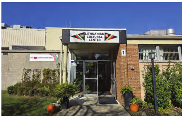
Detroito lietuvių bendruomenė atvira lietuviams ir turintiems lietuviškų šaknų