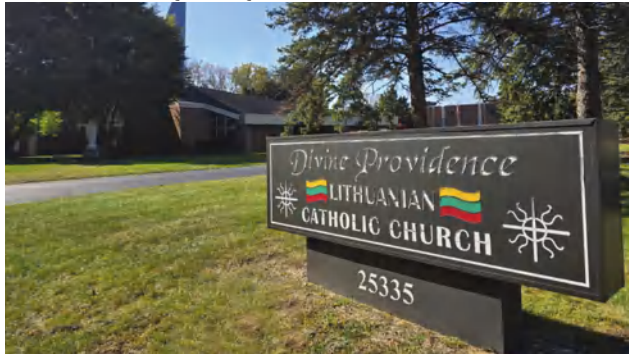
Dievo apvaizdos bažnyčioje kas sekmadienį aukojamos mišios lietuvių kalba