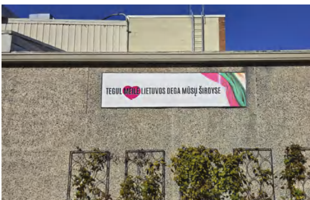
Amerikos lietuvių sako: būdamas toli, pradedi Tėvynę mylėti stipriau...