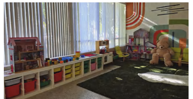
Šeštadieninio lietuvių darželio grupė

Ne visi JAV įsikūrę lietuvių dažnai grįžta į Lietuvą, bet kiekvienas grįžimas yra didžiulė nostalgija, – pasakoja žmonės. „Kiekvienąkart apsilankius Lietuvoje, o po to grįžus į JAV, atrodo, kad dalelė tavęs kaskart lieka Tėvynėje. Būdamas toli, tu pradedi kitaip jausti, pradedi Tėvynę idealizuoti ir mylėti stipriau...“