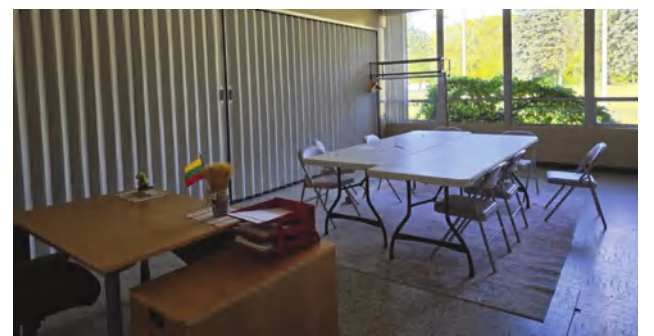
Lietuvių mokyklėlėje vaikai mokomi kalbos ir tradicijų