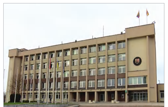
Marijapolės savivaldybės administracijos pastatas