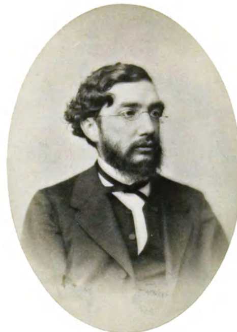
Aleksandras Hilferdingas

Žmonės visai kalbėjo, kad jis ir mūšyje žuvo, ir dvarą pirkto, ir į Prancūziją pabėgo. Šiaip ar taip, bet garsusis „svieto lygintojas“ dingio iš Užnemunės krašto. Belieka tikėtis, kad ateity bus sukurtas filmas apie dar vieną Lietuvos dvarininkų siaubą.