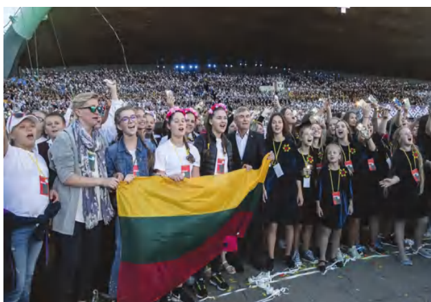
Pasaulio lietuvių suvienijo Lietuvos valstybės himno „Tautiškos giesmės“ giedojimas. Centre – Lietuvos Respublikos Seimo Pirmininkas Viktoras Pranckietis Vilnius, 2018 m. liepos 6 d.

2002 m. birželio 4 d. Lietuvos Respublikos švenčių dienų įstatymą pakeitė įsigaliojęs Lietuvos Respublikos darbo kodeksas. Darbo kodekso straipsnyje „Švenčių dienos“, reglamentavusiame nedarbą švenčių dienomis, buvo įtvirtinta, kad įmonėse, įstaigose ir organizacijose nedirbama, be kitų tame straipsnyje išvardytų dienų, ir „liepos 6-ąją – Valstybės (Lietuvos karaliaus Mindaugo karūnavimo) dieną“.