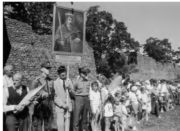
Pirmasis Mindaugo karūnavimo – Valstybės dienos minėjimas vyko 1991 metais. Pirmosios Valstybės dienos iškilmės vyko Medininkų pilies teritorijoje Medininkai, Vilniaus r., 1991 m. liepos 6 d. 0-130053