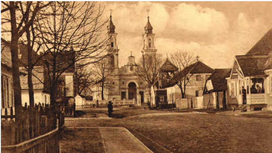
Marijampolės bažnyčia XX a. pradžioje; dešinėje matyti stačiatikių maldos namai