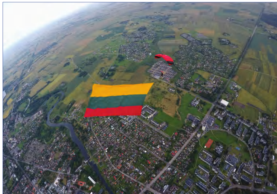
V. Gustaitis: „Kažką padaryti dėl Lietuvos galime kiekvienas“