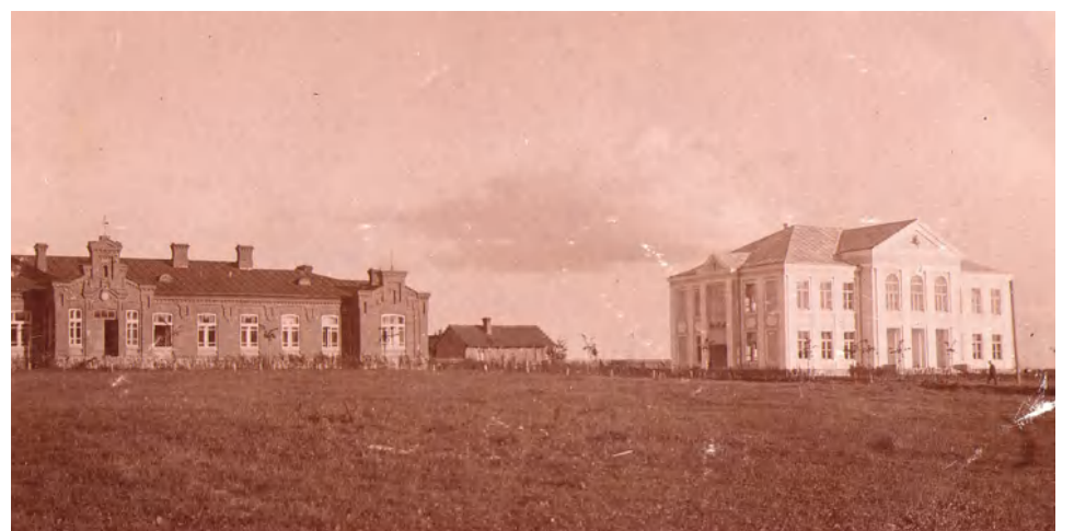
Marijampolės mokytojų seminarija

Vis tik 1925 m. tikrai pradėta statyti dviejų aukštų santūraus neoklasicistinio stiliaus rūmus, o statybos darbai baigti 1926 m. Tiesa, dar ir 1928 m., švenčiant valstybės atkūrimo dešimtmetį, stovėjo grubus netinkuotas statinys su keliais „negyvais“ langais.