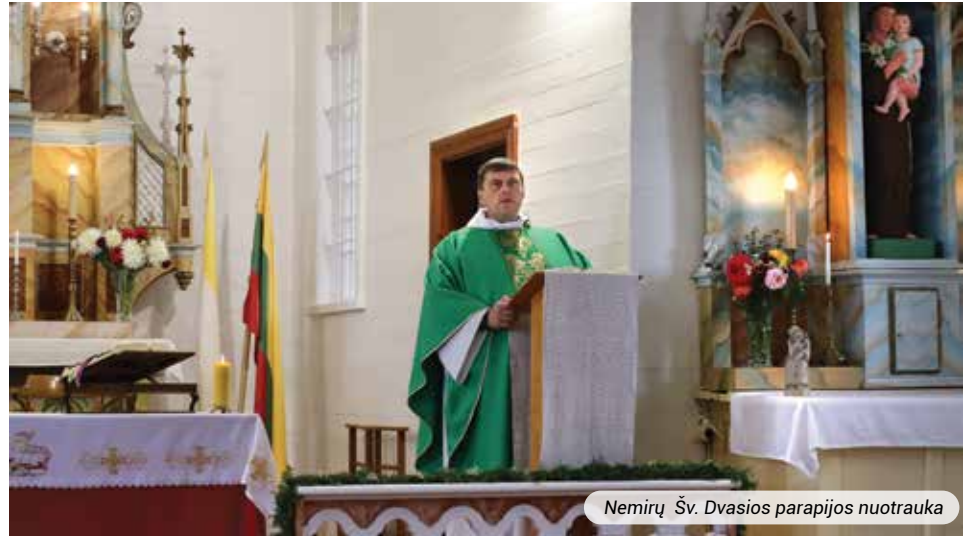
Nemirų Šv. Dvasios parapijos nuotrauka

Iš tikrųjų, rodos, kad su kiekvienu metais šventės, kurios būnant vaiku, atrodė magiškos ir stebuklingos, dabar ne vienam iš mūsų asocijuojasi su rūpesčiais, pareigomis ir vis nepakankamai išpildytomis mamoms tėčio sesės brolio kolegos ir kitomis rolėmis. Norisi palinkėti, kad šis advento laikotarpis taptų paskaita bent kartais nusimesti slegiančius pareigų ir rūpesčių rūbus ir susitikti su tuo tikruoju savimi, kuris po jais slepiasi, bei paklausti: kas tu? Kaip