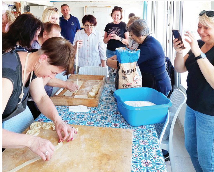
Italų šeimininkės moko gaminti velykinius patiekalus

Pagrindinės veiklos Europoje, kaip ir mūsų - paskaitos bei susitikimai su įvairių sričių specialistais (mėgstamiausi lektorai - keliautojai, menininkai, istorikai), užsiėmimai būreliuose ir kelionės po savo šalį ir užsienį.