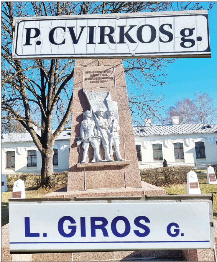
Iš Vilniaus signalą gavusi Marijampolės valdžia pasirūpino nugriauti paminklus sovietų kariams, bet kolaborantų, laiminusių Lietuvos okupaciją, atminimą įamžinantys gatvių pavadinimai liko. Neįmanoma laukiama „centro“ nurodymų?

P. Cvirkos, L. Giros gatvių pavadinimus dar prieš porą metų pakeitė Šiaulių miesto savivaldybė.