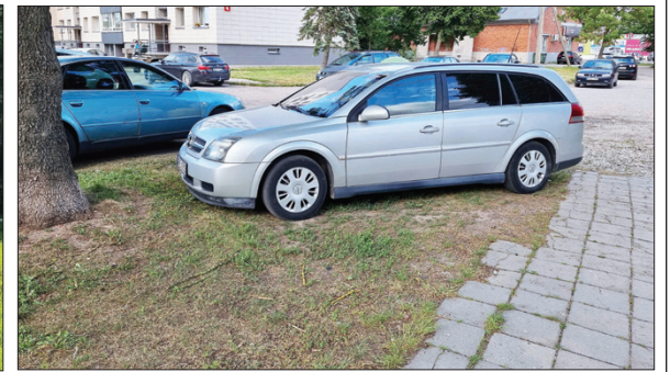
Kam asfaltuoti aikštes, jei kiemuose dar liko žaliųjų vejų