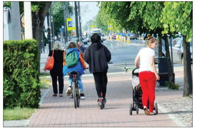
Tarp pėsčiųjų nardo dviratis ir paspirtukas, nors čia pat jiems skirtas takas