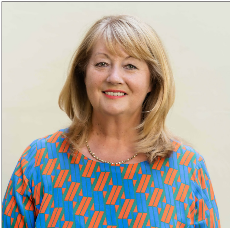
Vilija Blinkevičiūtė: „Jei žmonės skurs, didės atskirtis, planuoti ir kurti sėkmingą Europos ir Lietuvos ateitį bus sudėtinga.“

- Europos Komisijos vertinimai – tai žvilgsnis į Lietuvą iš šono, ne per rožinius akinius. Vertinimai nenustebino: Europos Komisija nepasakė nei nieko naujo, nei nieko labai gero. Viskas, ką ga-