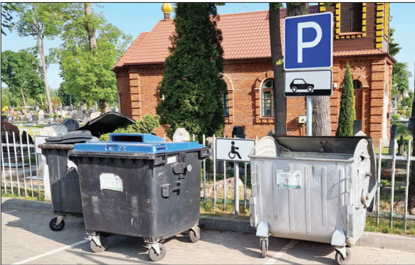
Pagal įstatymą, už neteisėtą automobilių parkavimą neįgaliesiems skirtose vietose vairuotojai gali gauti baudą nuo 60 iki 180 eurų. Įdomu, kas vairuoja šiuos kontenerius, priparkuotus šalia miesto senųjų kapinių?