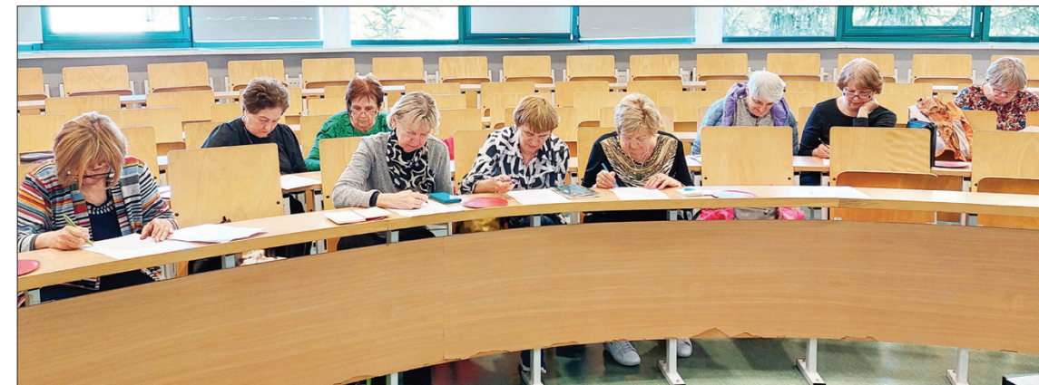
Atminties treniruotės užsiėmime Lenkijoje

Ateityje planuojama rengti atvirus užsiėmimus visiems TAU studentams, pavyzdžiui, kartą per mėnesį norintys galės ateiti į folkloro ansamblio repetitiją ir kartu mokytis dainuoti liaudies dainų arba mokytis linijinių šokių būrelyje. Sumanymų nemažai, bet reikia ir lėšų, ir savanorių, kurie padėtų juos įgyvendinti, skirtų savo laiko ir darbo, kad universiteto veikla taptų dar patrauklesnė, į ją įsijungti galėtų daugiau marijampoliečių.