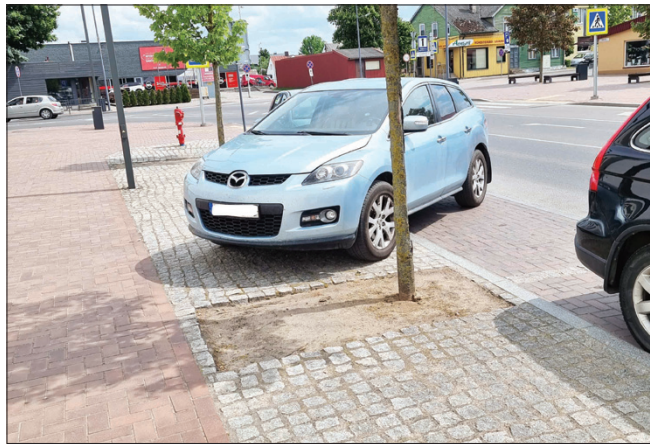
Automobilių parkavimo laisvė Laisvės gatvėje