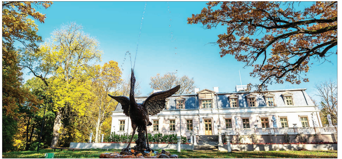
Žagarės dvaro sodyba

Tai – Gačionių dvaro sodyba Rokiškio rajone, supama nuostabaus parko, kurio medžiuose yra