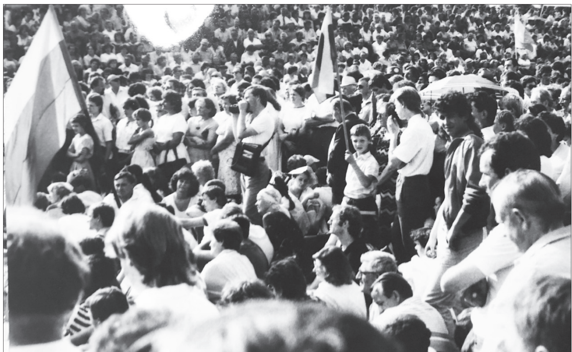
1988 m. liepos 13 d., pirmasis Sąjūdžio mitingas Marijampolėje, Rygiškių Jono gimnazijos (tada – Jono Jablonskio vidurinės mokyklos) stadione