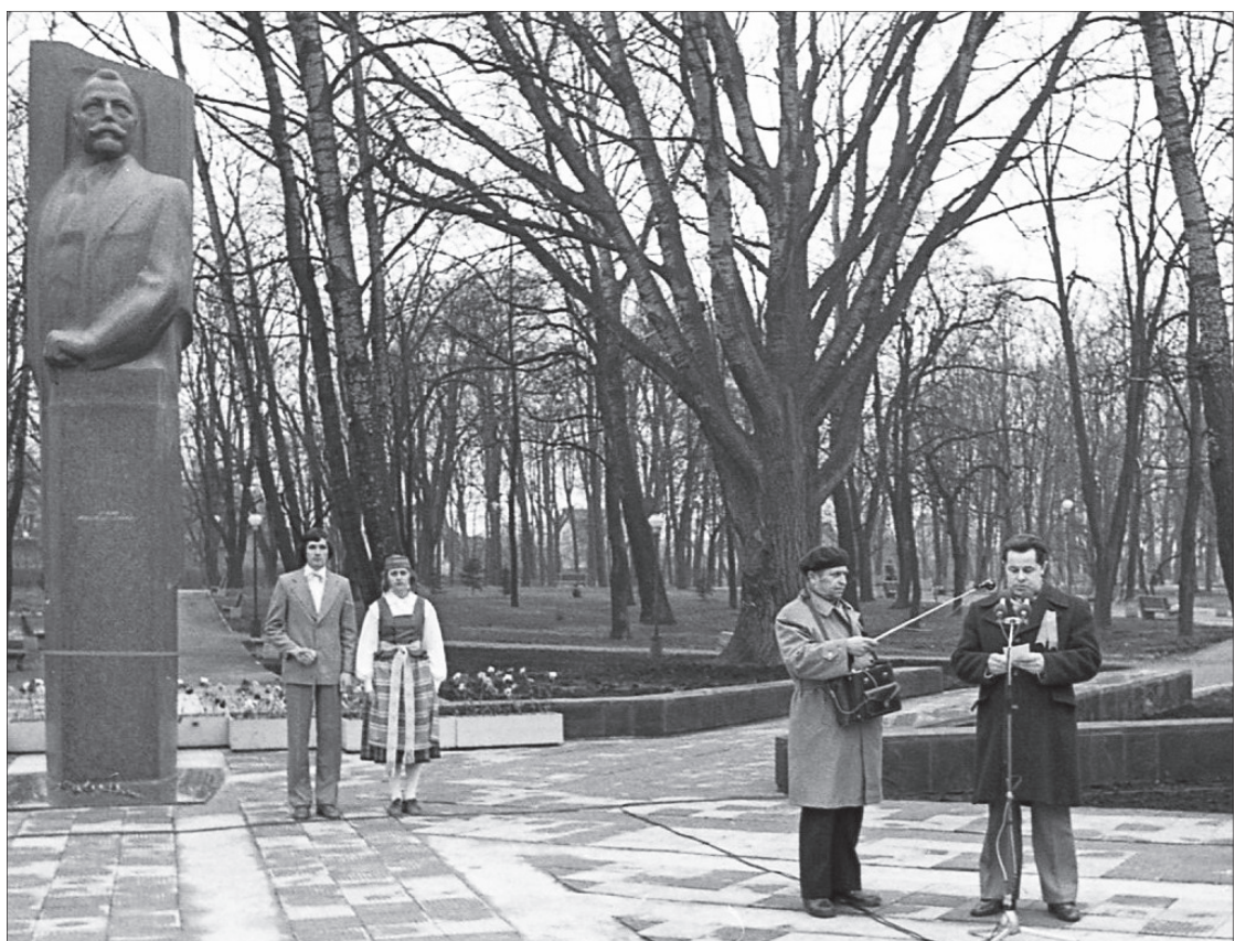
1980 m. balandžio 7 d. Paminklo Kapsukui atidengimo ceremonija.