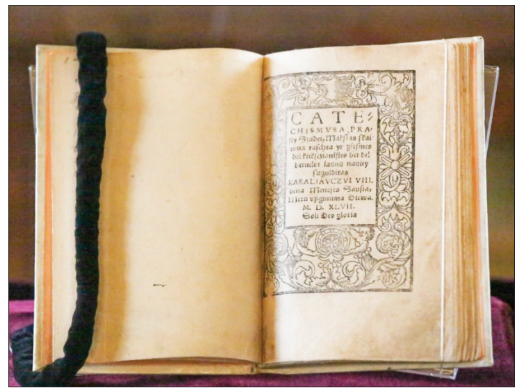
M. Mažvydo „Katekizme“ išspausdinta 11 giesmių

Giesmės įtaką paprastam žmogui ir jo tikėjimui puikiai atspindi Lietuvos jėzuitų kongregacijos raštas jėzuitų generolui Klaudivijui Akvavivai: „Dėl to, kad mūsų bažnyčiose negiedama, krenta liaudies pamaldumas; daugelį žmonių kitos bažnyčios ne kuo kitu