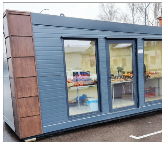
Toks pat konteineris, „atsisukęs“ priekiu į Žemaitės gatvę