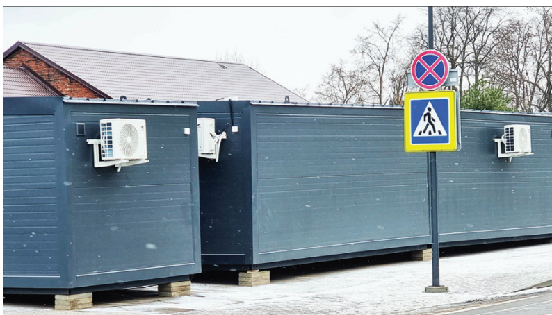
Ant konteinerių sienos sukabinti oro kondicionieriai, dėl kurių įrengimo daugiabučių gyventojai turi įveikti nemažai biurokratinių kliūčių. Esą tam, kad šie aparatai negandintų vaizdo. Čia kondicionieriai vaizdą, matyt, puošia...