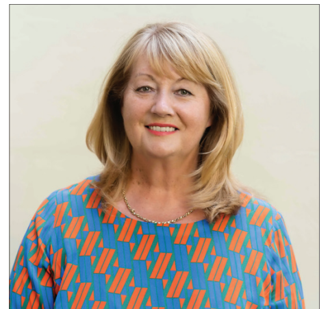
Vilija Blinkevičiūtė: „Dažnai žmonių akyse matau daug nerimo dėl ateities. Bet tose pačiose akyse matau daug šviesos, gerumo ir supratimo, kad tik padėdami vieni kitiems sulauksime geresnių laikų.“

Deja, bet neįgalieji ES ir toliau susiduria su kliūtimis: nuo fizinių, sveikatos apsaugos, socialinių poreikių tenkinimo iki integracijos mokykloje ar darbo rinkoje. Todėl