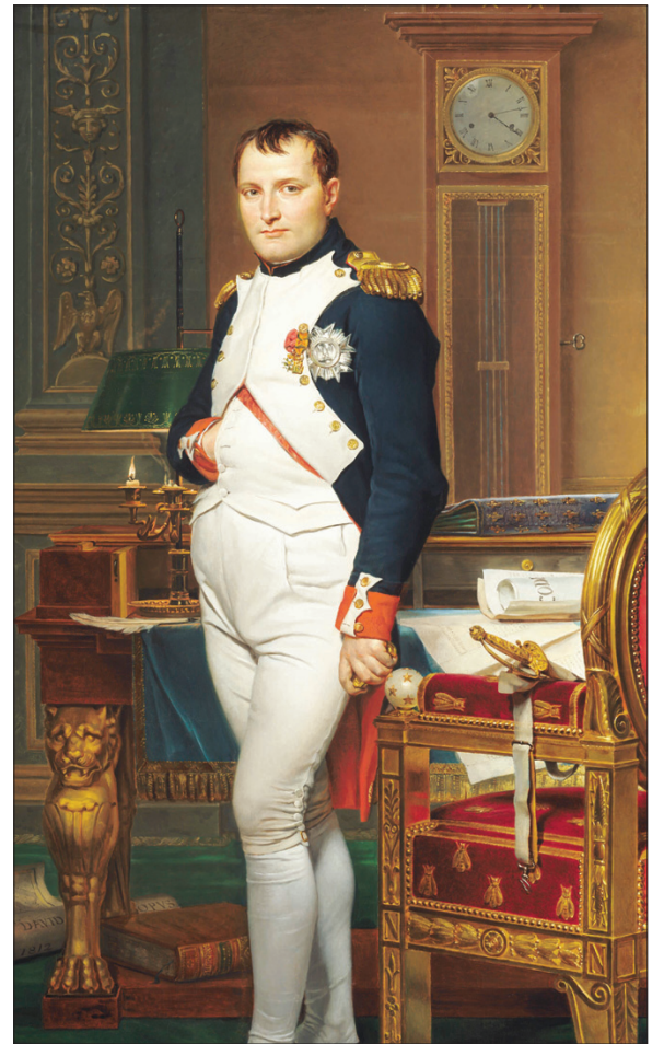
Napoleonas. Vašingtono meno galerija

lika dienų, į Paryžių Napoleonas atvyko gruodžio 18 d. iki vidurnakčio likus pusvalandžiui.