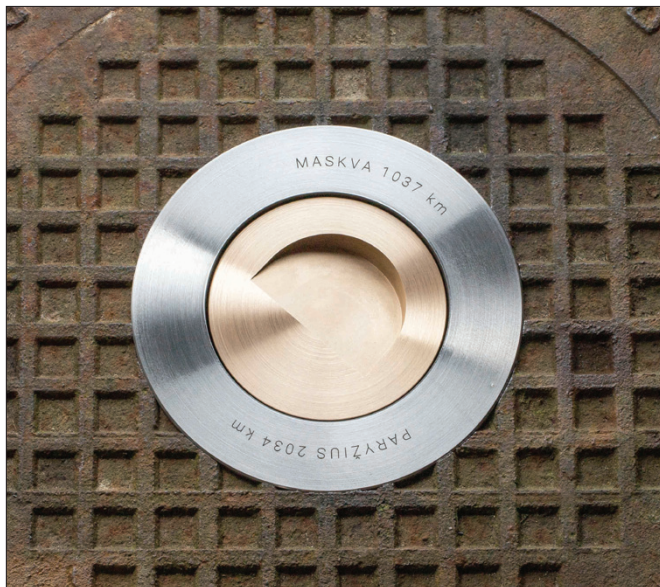
Štai tokį Napoleono bato kulną sukūrė auksakalys

Kur tuo metu veikė pašto stotis? Arklių pašto stoties dabartinio kino teatro vietoje tada dar nebuvo. Sklido legenda apie „Napoleono namą ar arklides“ J. Basanavičiaus a. 20, kuris neseniai nugriautas ir jo vietoje pastatytas naujas.