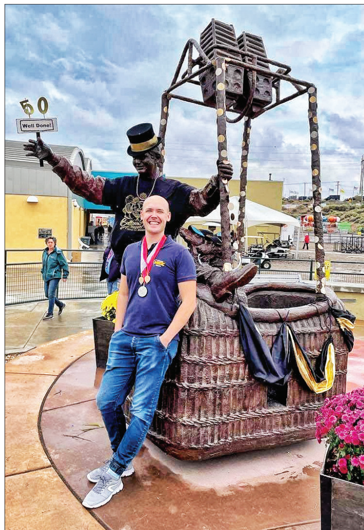
Rokas po apdovanojimo nusifotografavo prie oreivio skulptūros

Jis iš Albuquerque parsivežė sidabro medalį. Varžybose dalyvavo maždaug pusė iš 650 festivalyje į padangę balionus kėlusiu pilotų, o marijampolietis nusileido tik JAV atstovui. Europiečių startavo mažai, absoliučią daugumą sudarė amerikiečiai.