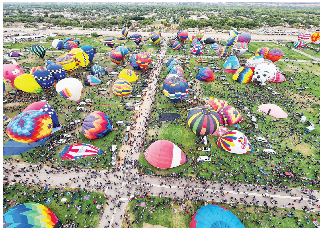
Albuquerque karšto oro balionų stadione

Dešimt dienų vykusią fiestą savaitgaliais stebėdavo daugiau kaip 100 tūkstančių žiūrovų. Rokas mini kerintį vaizdą, kai anksti ryte, dar neprasvitus gausybė automobilių juda link stadiono – žmonės nori pamatyti kylančius balionus. „Dėl šio reginio susidarydavo didžiuliai mašinų „kamščiai“, - prisimena Rokas.