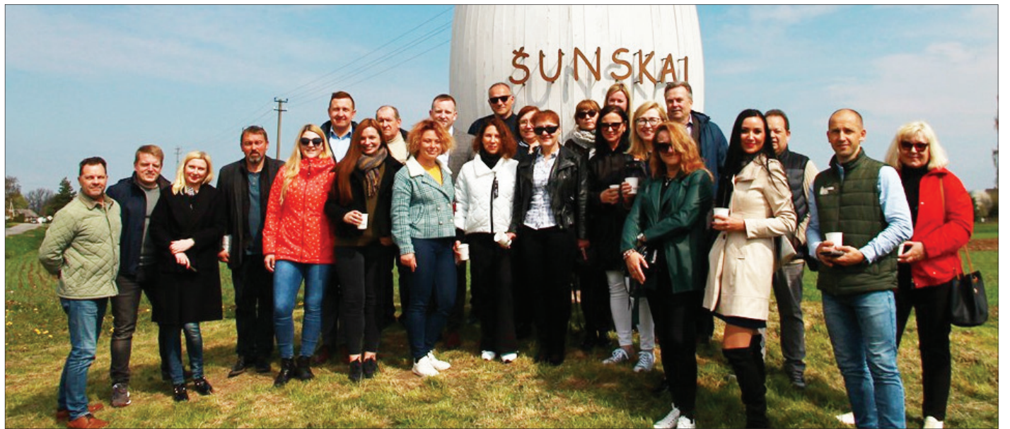
Marijampolės valdžios ir žinia(valdžia)sklaidos vienybė šiemet demonstruota Šunskuose. Čia meras pakvietė kartu minėti Spaudos atgavimo, kalbos ir knygos dieną

Žurnalistai, tapę valdžios spaudos atstovais, komunikacijos departamentų vadovais ir tarnautojais, viešųjų ryšių agentūrų savininkais ir darbuotojais, nors dažnai tituluojantys save nepriklausomais ekspertais, analitikais ar konsultantais, iš tikrųjų perėjo į reklamos agentūrų ir komivojažierių gildiją, kuri vietoje įprastų prekių parduotuvės politikus, partijas, ministrus, ministerijas ir