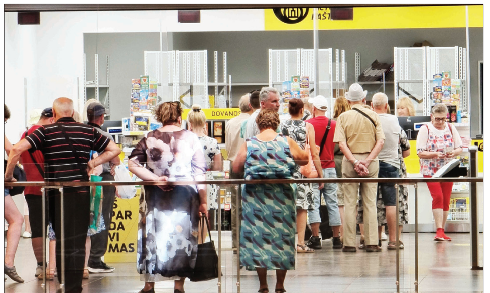
Tokios eilės retos net prie „Maximos“ kasų

Skelbimas Bažnyčios gatvėje ant kiosko, kurio „brolis“ Dariaus ir Girėno gatvėje jau senokai nukeltas