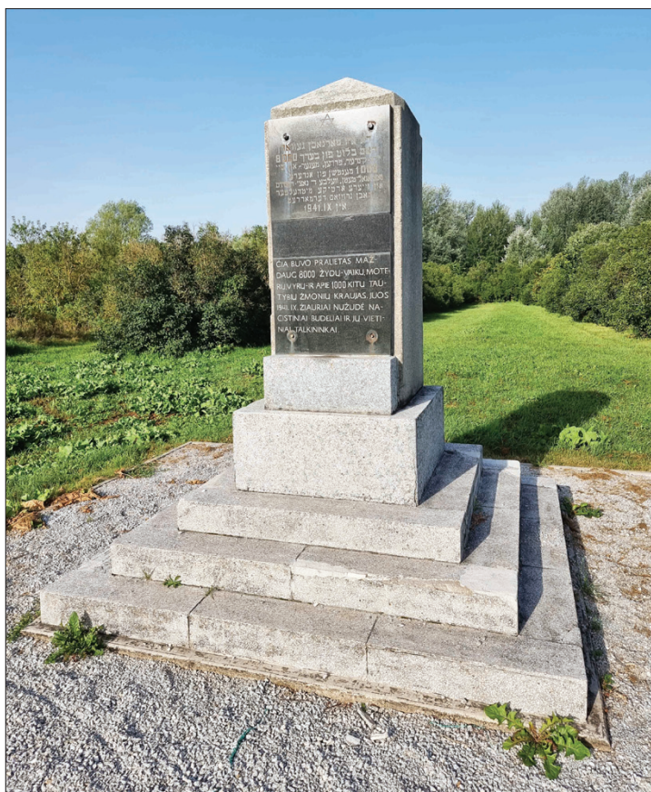
Prie žydų žudynių vietą žyminčio paminklo reikia eiti dar sovietmečiu asfaltuoto tako liekanomis, kurių pusė apžėlususi - pieva ir tiek...