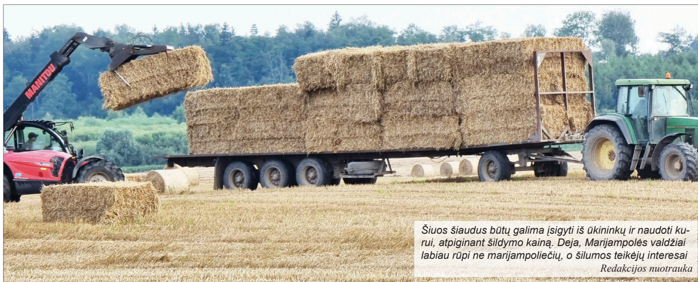
Šiuos šiaudus būtų galima įsigyti iš ūkininkų ir naudoti kurui, atpiginant šildymo kainą. Deja, Marijampolės valdžia labiau rūpi ne marijampoliečių, o šilumos teikėjų interesai