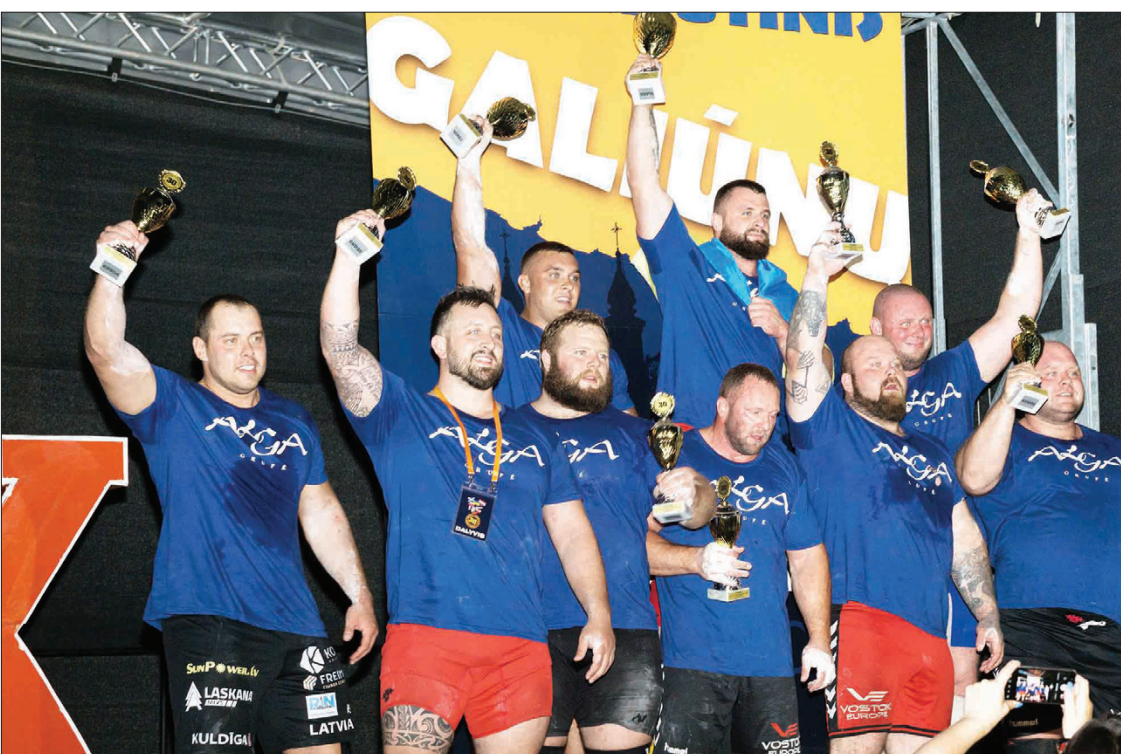
Galiūnai tik ką pasibaigus jubiliejinio turnyro kovoms