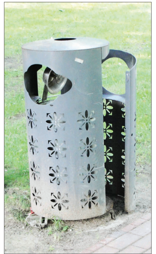
Poezijos parkas. Išėmus šiukšles, dėžė „pamiršta“ uždaryti

Baigdamas noriu pasidžiaugti, kad tremties parkelis prie gražiausios Lietuvoje geležinkelio stoties pagaliau sutvarkytas. Gal padėjo kritika „Miesto laikraštyje“, o gal miesto vadovai sukruto.