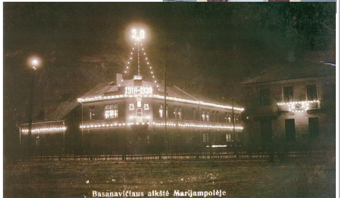
Marijampolės rotušė 1938 m.