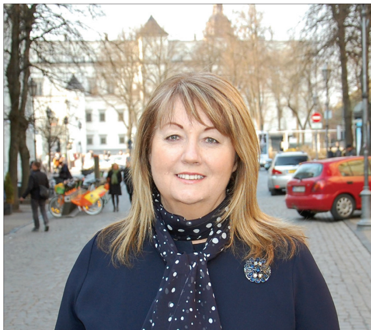
Vilija BLINKEVIČIŪTĖ, Europos Parlamento Socialistų ir demokratų pažangiojo aljanso frakcijos narė

- Europos Sąjungos (ES) Vaikų garantijų iniciatyva numato, kad vaikams turi būti užtikrintas stogas virš galvos, šiltas būstas, maistas, galimybė nemokamai kokybiškai mokytis, lavintis, gydytis.