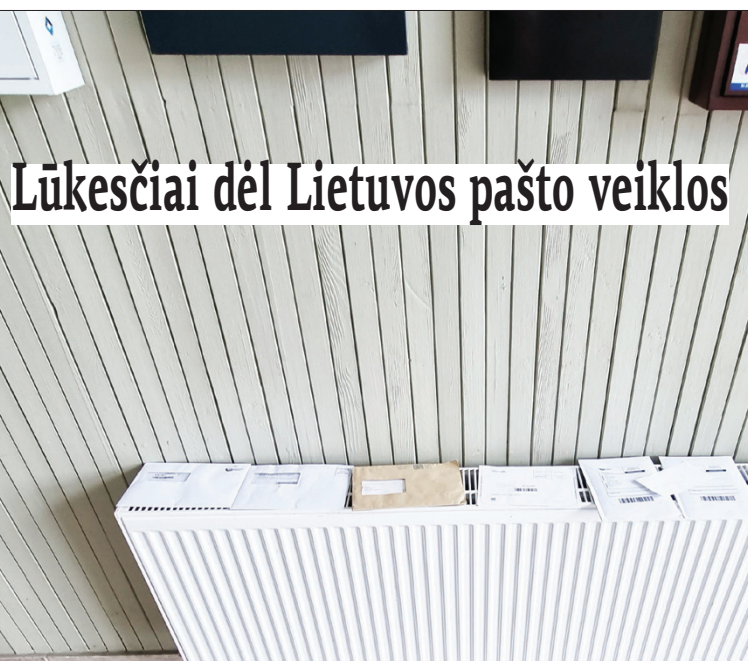
Kauno g. 15. Korespondencija, kurios adresatų neranda, paštininkai palieka ant radiatoriaus. Šie laišukai čia guli jau trečia savaitė....