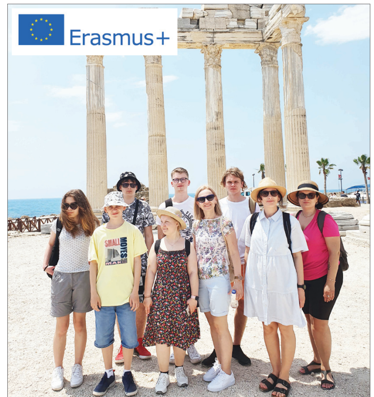
Marijampolės šv. Cecilijos gimnazijos delegacija Sidės mieste

Gera dalyvauti, patirti, mokytis, susidraugauti bei pažinti kitų šalių žmones, jų papročius bei tradicijas. Gera būti komandos dalimi, siekiančia vieno tikslo – visapusiškos asmenybės ugdymo ne tik mokykloje, bet ir per naujus patyrimus. O dabar mūsų laukia dar vienas susitikimas Rumunijoje. Naujai patirčiai ir pažinimui sakome „TAIP“!