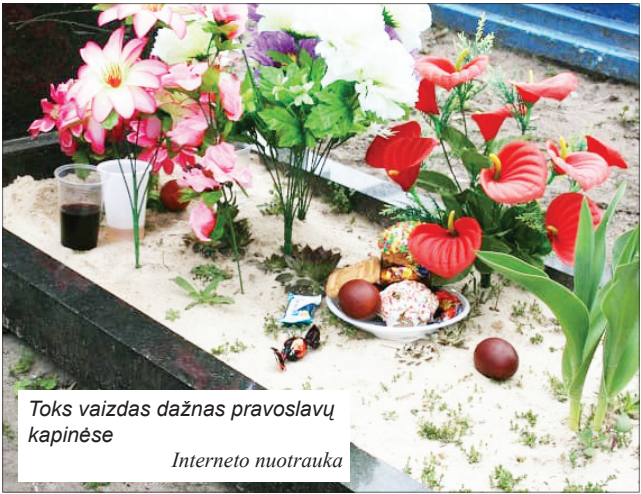
Toks vaizdas dažnas pravoslavų kapinėse