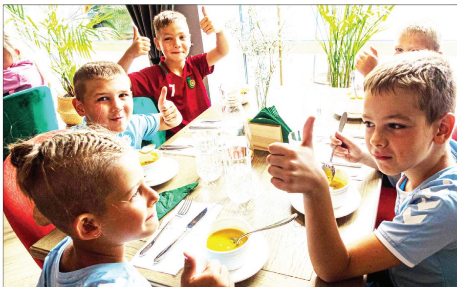
Po žaidimų lauke pietūs kaip niekada skanūs. Nuotrauka daryta praėjusiais metais futbolo akademijos „Marijampolė city“ organizuotoje nemokamoje vasaros vaikų stovykloje

„Didelę nuostabą kelia ir tai, kad yra nebiudžetinių neformaliojo ugdymo įstaigų, kurios pakankamą finansavimą projektams gavo gerokai anksčiau, nei buvo pradėta kalbėti apie vasaros vaikų užimtumą. Savivaldoje vis dar yra lygesnių už lygius tiek versle, tiek tarp biudžetinių įstaigų, todėl tėveliai turės paislaidauti norėdami užtikrinti savo mažųjų turiningą poilsį“, - pastebi MKC direktorė.