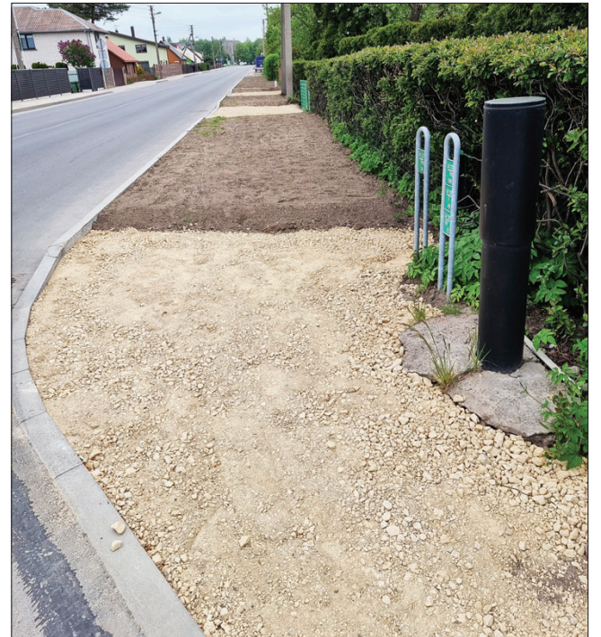
Šaulių gatvė. O šaligatvio taip ir nenutiesė

Taupyta pinigų ir tvarkant viešąją erdvę Pašešupio parke, priešais R. Juknevičiaus gatvės 100-ąją namą. Čia atnaujinta krepšinio aikštelė. Puiku, tačiau šalia liko ištrupėjusio asfalto, kuriame įrengti treniruokliai. Gal „atodanga“ palikta priminti sovietmetį, kaip kad atnaujinant senus namus paliekama šiek tiek autentiško mūro.