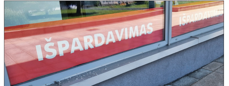
Nors parduotuvės seniai nė kvapo