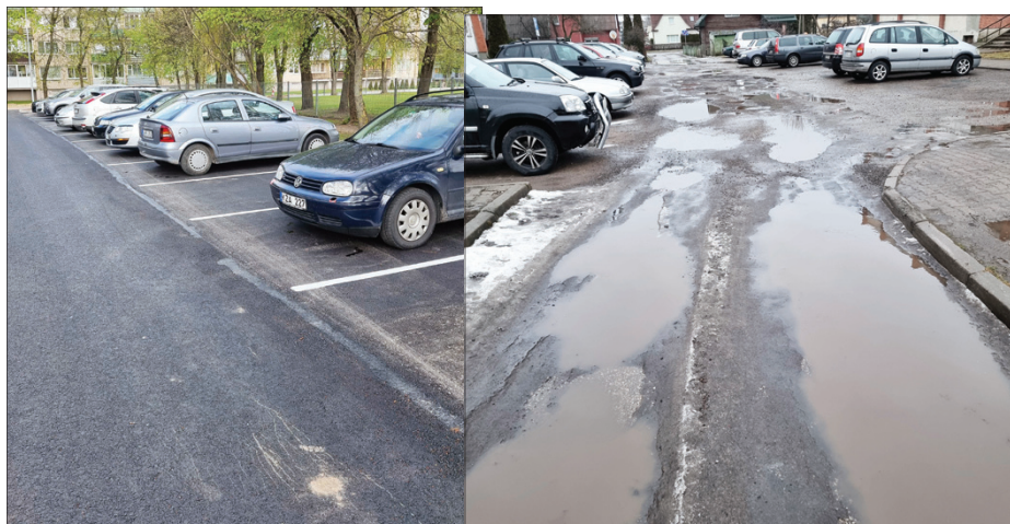
Valdiška aikštelė prie „Sūduvos“ gimnazijos, o šiai tvarkyti gyventojai turi skirti savo pinigų

Žodžiu, pavyzdžiu Kokolos gatvės vairuotojams. Manau, kaip ir kiti marijampoliečiai, kurie negyvena šalia valdiškų ar prekybos centrų priklausančių automobilių stovėjimo aikštelių,