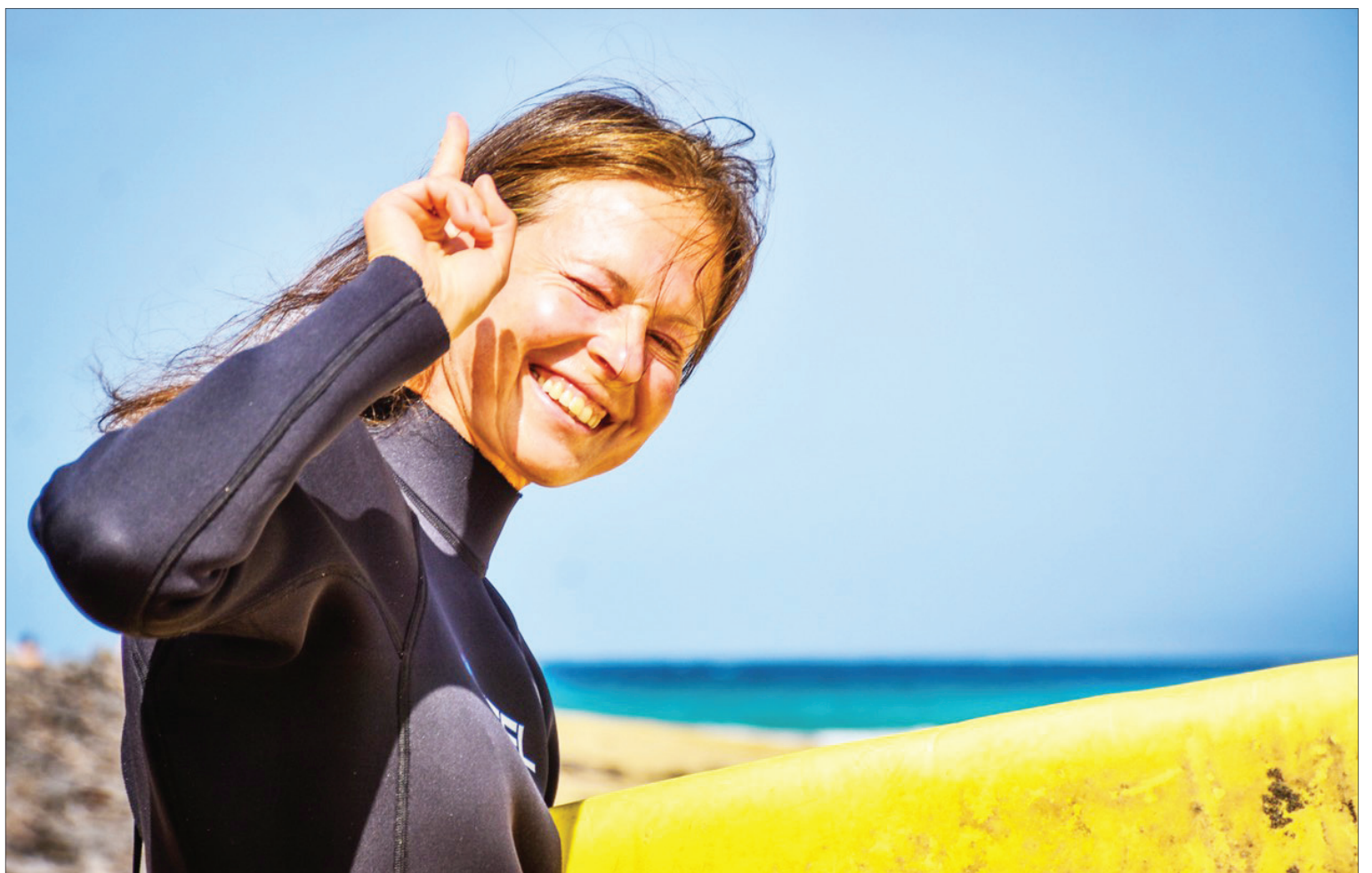
Portugalija, banglentininkų pamėgtame Arifanos paplūdimyje

jote kalnuose. Kartu vyko jūsų tėvas, vaikai. Taip puoselėjate kartų ryšį?