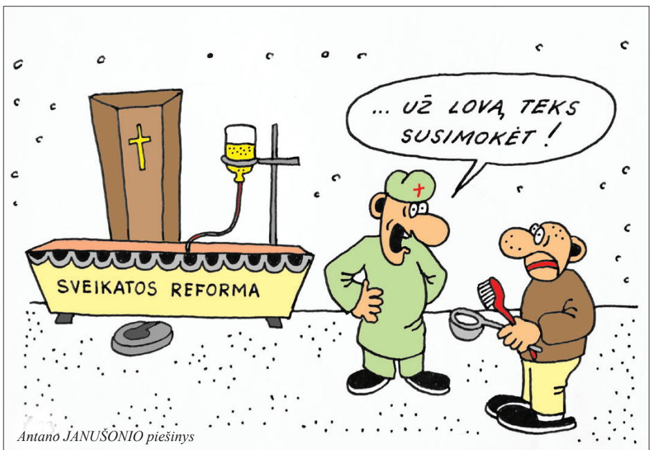
Antano JANUŠONIO piešinys

Kada juos priims specialistai, jau ne šeimos gydytojo problema. Jam rūpi, kaip paimti uždirbtus pinigus iš Valstybinės ligonių kasos, dalyvaui kiek įmanoma didesniame skaičiuje jos finansuojamų projektų.