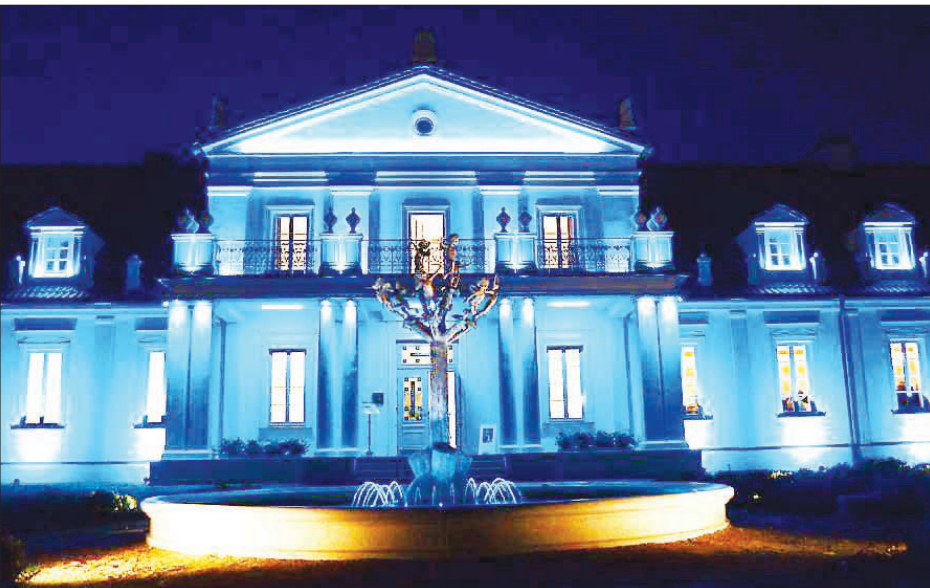
Ilzenbergo dvaras (Rokiškio r.)

Nuotykių trasos. Šalia Varėnos miesto nuo gegužės mėnesio atsiras naujos orientavimosi trasos – 3 iš jų gretimuose miškuose (Šeimos, Vaikų ir Nuotykių trasos), o viena apims miesto objektus.