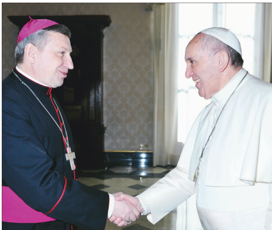
Su Popiežiumi Pranciškumi