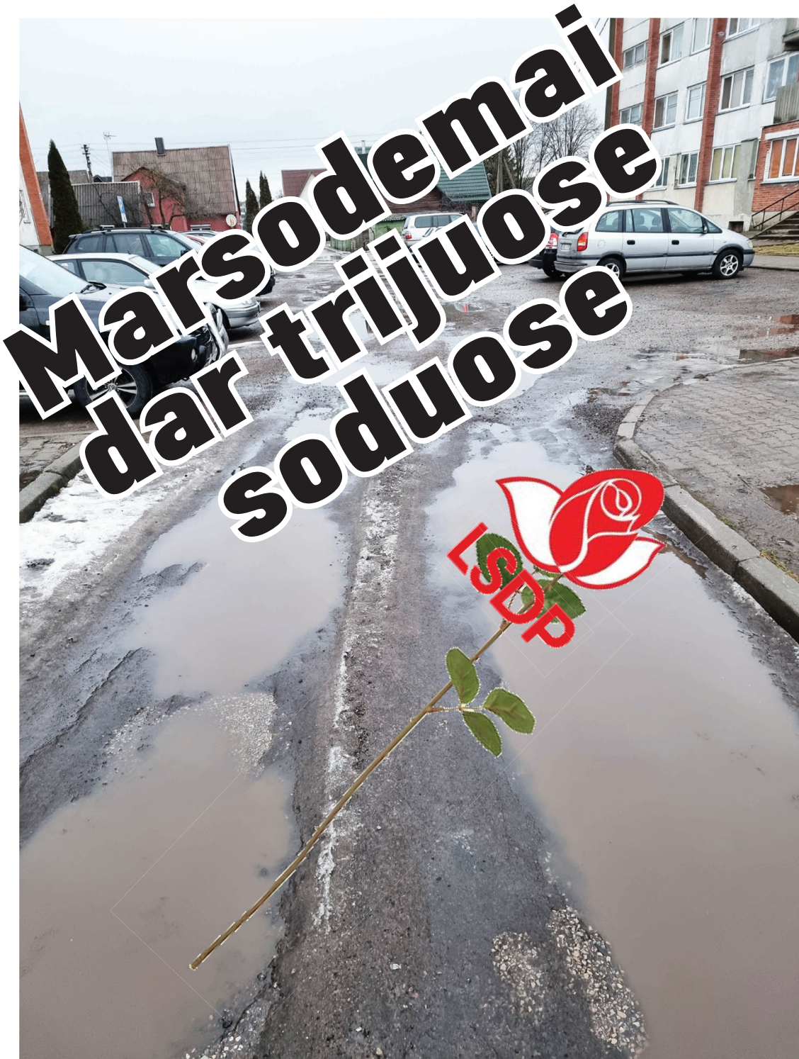
Kadangi čia gandrai nesiporuoja, valdžia neasfaltuoja. Tarp kiemų įsispraudusi bevardė gatvelė, jungianti P. Cvirkos, Vinčių ir Kalvių gatves, asfaltuotojų nematė daugiau kaip dešimt metų