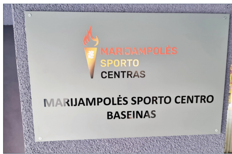
Ta pati „vizitkė“ Jaunimo g. ir Mokoluose

Pavadinimus turi dauguma šalies viešųjų baseinų. Antai Kaune yra „Dainava“, „Girstutis“, Vilniuje – „Fabijoniškių“, „Olimpo pradžia“ ir t. t. Mūsiškiai, sprendžiant iš „vizitinės kortelės“, net nesunumeruoti. Gal ir nereikia. Vienas tegul lieka „Sveikatos banga“ (kaip liko stadionas „Sūduva“, nors jo pavadinimą siekė ištrinti futbolininkas, dabartinio direktoriaus pirmtakas), kito pavadinimui galima būtų paskelbti konkursą.