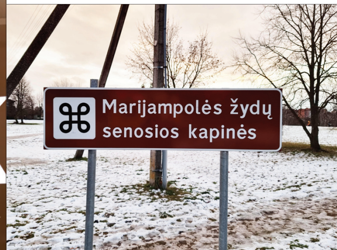
Kitos nuorodos (vienos fragmentas nuotraukoje kairėje) eizėja