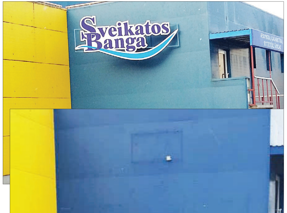
Nebeliko ir Mokolų firminio ženklų