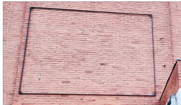
Kai kurie „Miesto laikraščio“ skaitytojai buvusios Žaidimų sporto mokyklos pavadinimo vietoje siūlo pritvirtinti krepšinio kamuolį arba jo nuotrauką, kad fasadas neatrodytų nykus – dabar vaizdas toks, lyg už sienos sandėlys

„Dėl ŽSM (žaidimų sporto mokykla) viskas aišku – tokios įstaigos nėra, tad ir didžiulės iškabos nereikia. O štai baseinas (Jaunimo g. –