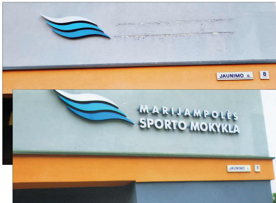
Jaunimo gatvės baseino pavadinimas prieš mėnesį tiesiog nudraskytas... (nuotrauka viršuje)