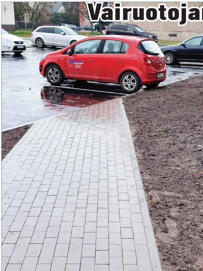
Čia takas prasideda...