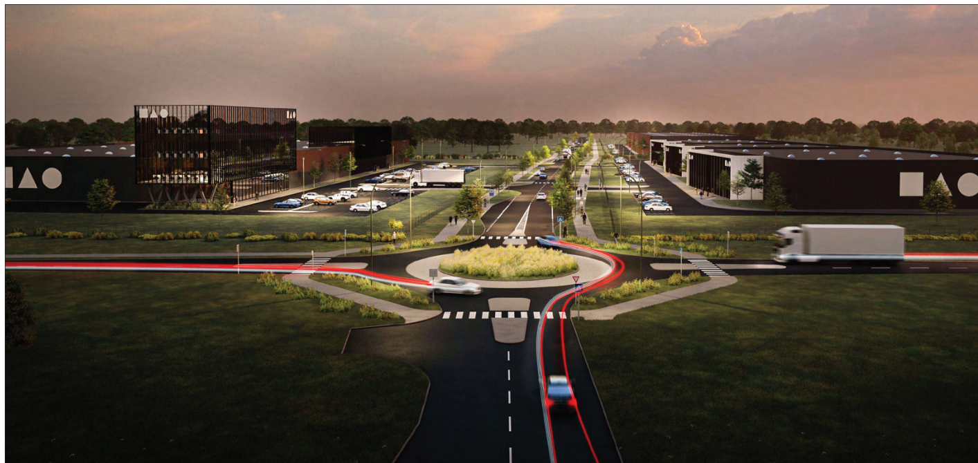
Taip Laisvojoje ekonominėje zonoje galėtų atrodyti žiedinė sankryža ir Vasaros g. link vedanti gatvė, abipus kurios siūlomi sklypai investuotojams. Vaizdas nuo įmonės „Dovista“ pusės

Daugiau informacijos: www.balticfez.com , el. paštu info@balticfez.com .