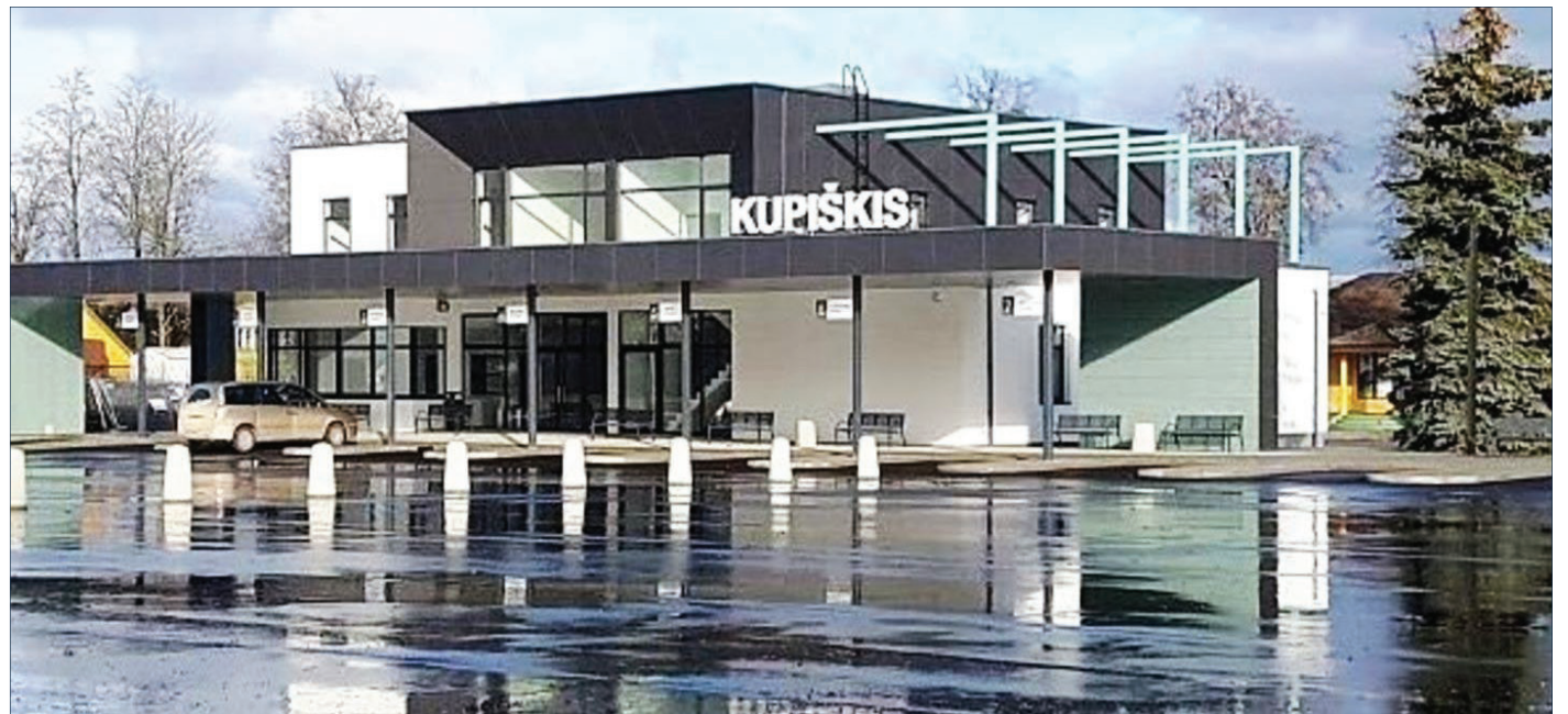
O taip atrodo respublikinio reitingo lyderė – Kupiškio autobusų stotis

• Muziejai, lankytojų centrai, dvarai ir