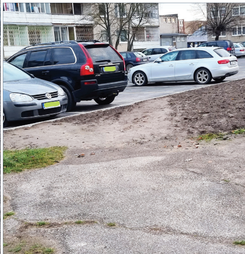
o čia tęsiasi