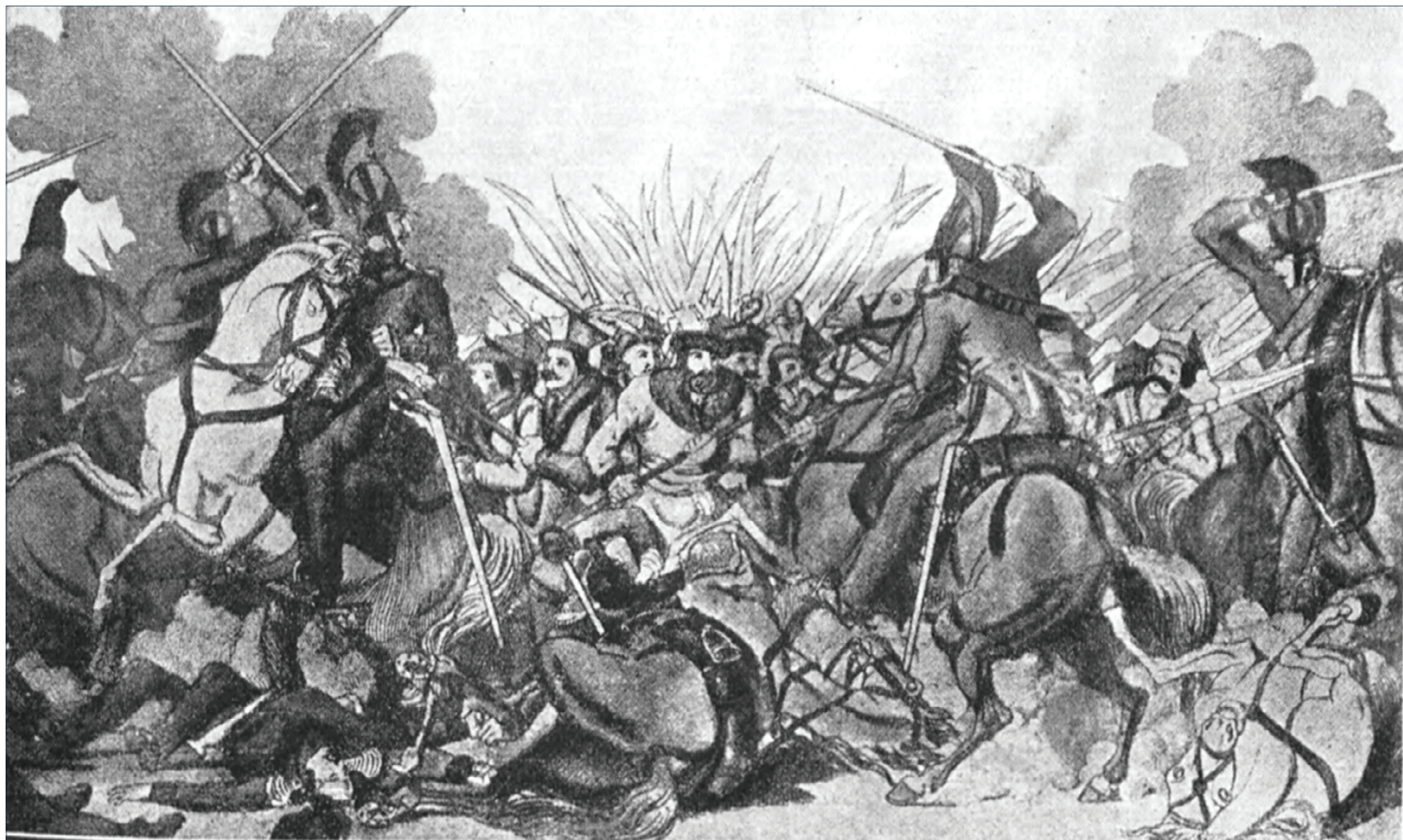
Mūšis prie Marijampolės. Paveikslo autorius nežinomas