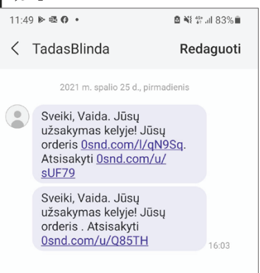
Sukčių siunčiamų pranešimų pavyzdžiai