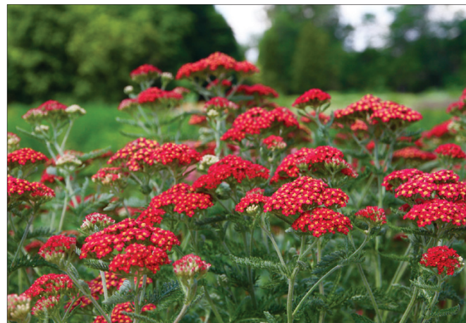
„Paprika“ (paprastoji kraujažolė)

pasodinus tinkamu laiku, gausiai tręšiant kompleksinėmis trąšomis, laistant, augalas gali jau pirmais metais taip suvešėti, kad jį galima padauginyti kero dalijimu.