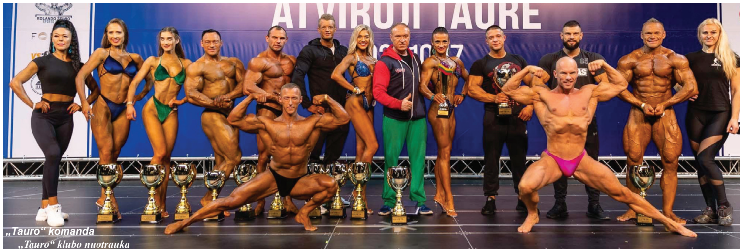
„Tauro“ komanda