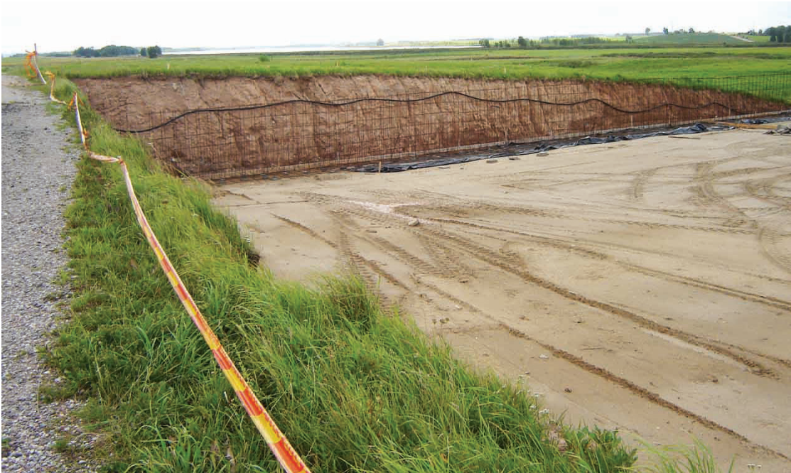
Prieš kelis metus prie Želšvos fermų sunaikinti Būriškių piliakalnio likučiai tapo ar siloso, ar srutų duobe. Piliakalnis nebuvo įtrauktas į paveldo sąrašus, todėl prieš nukasant ne netirtas