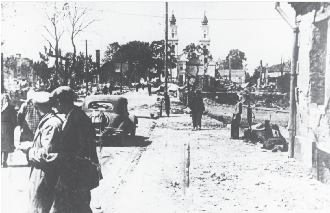
Marijampolės miestas Antrojo pasaulinio karo metu. 1941 m. birželio 23 d.

Šilavoto valsčiuje „tiltai apgriauti, pagadinti, bet pravažiuoti jais galima“. Balbieriškyje rasti 9 traktoriai, volai (greičiausiai naudoti sovietų aerodromo statybai), daug automobilių dalių, statinių. Gudelių valsčiuje, Amalviškių kaime, Meškelevičiaus lauke nukritęs dvimotoris lėktuvas, Daukšiuose, klebonijos kieme paliktas sugedęs sovietų kariuomenės sunkvežimis. Liu-