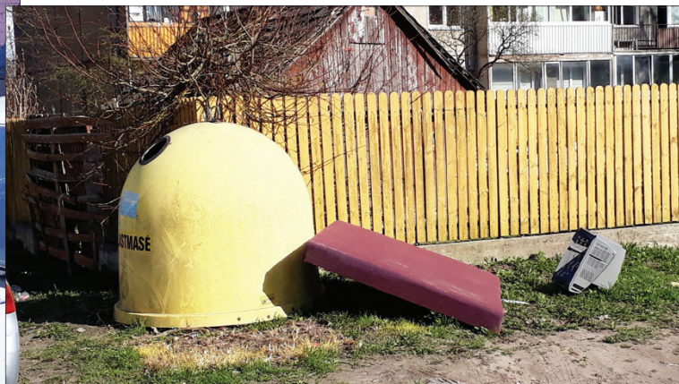
Čia, apleisto namo patvoryje, turėtų stovėti visi konteineriai