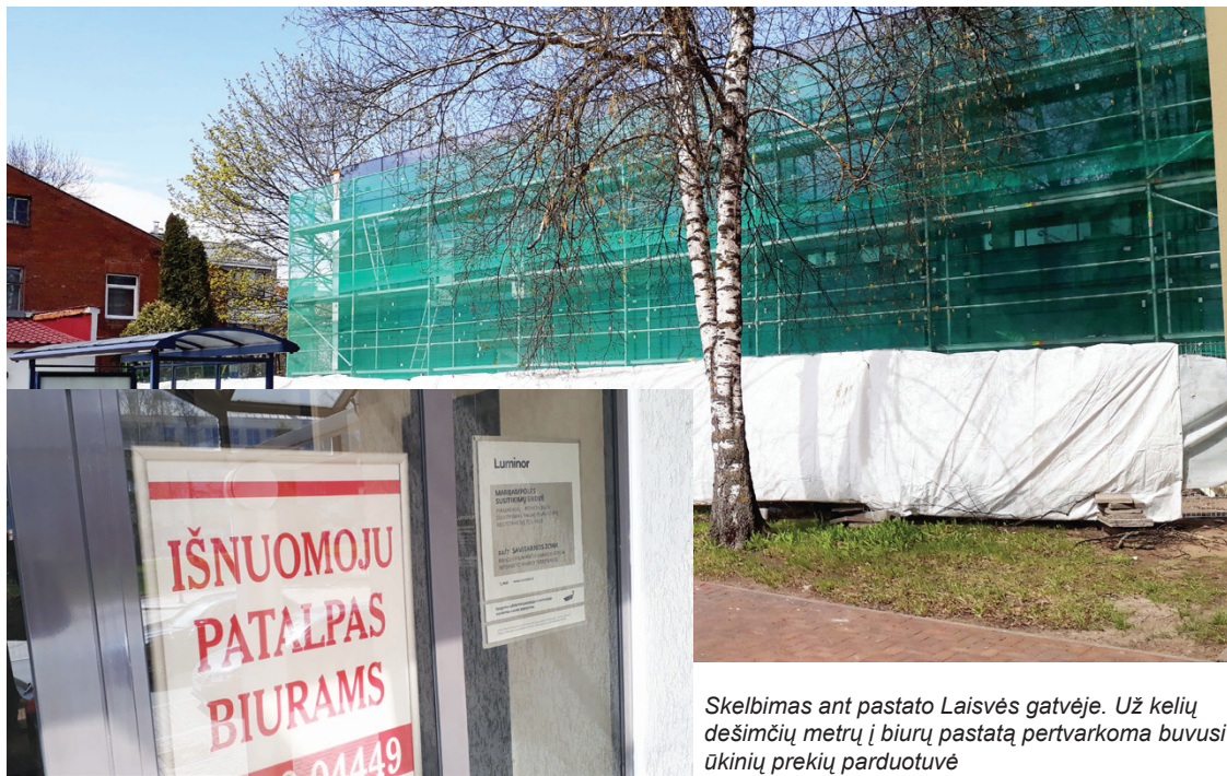
Skelbimas ant pastato Laisvės gatvėje. Už kelių dešimčių metrų į biurų pastatą pertvarkoma buvusi ūkinių prekių parduotuvė

Kylant naujiems biurų pastatams potencialūs nuomininkai vis mažiau dairosi į senos statybos objektus, nes jų kaina panaši. Todėl jau ilgą laiką gyvybės ženklų nesimato statiniuose, iš kurių išsikraustė „Swedbank“ ir SEB banko Marijampolės filialai. Įsigalint virtualiai bankininkystei, jie puikiai išsitenka