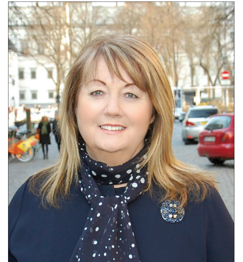
Vilija Blinkevičiūtė: „Kai kurios karantino priemonės buvo perteklinės.“

Galima pasiguosti bent tuo, kad dabar situacija pasikeitė. Reikėjo tuos nežmoniškų ribojimus naikinti anksčiau. Jokia krizė, joks karantinas negali reikšti nužmoginimo, negali atimti vilties ir uždrausti mylėti artimąjį.