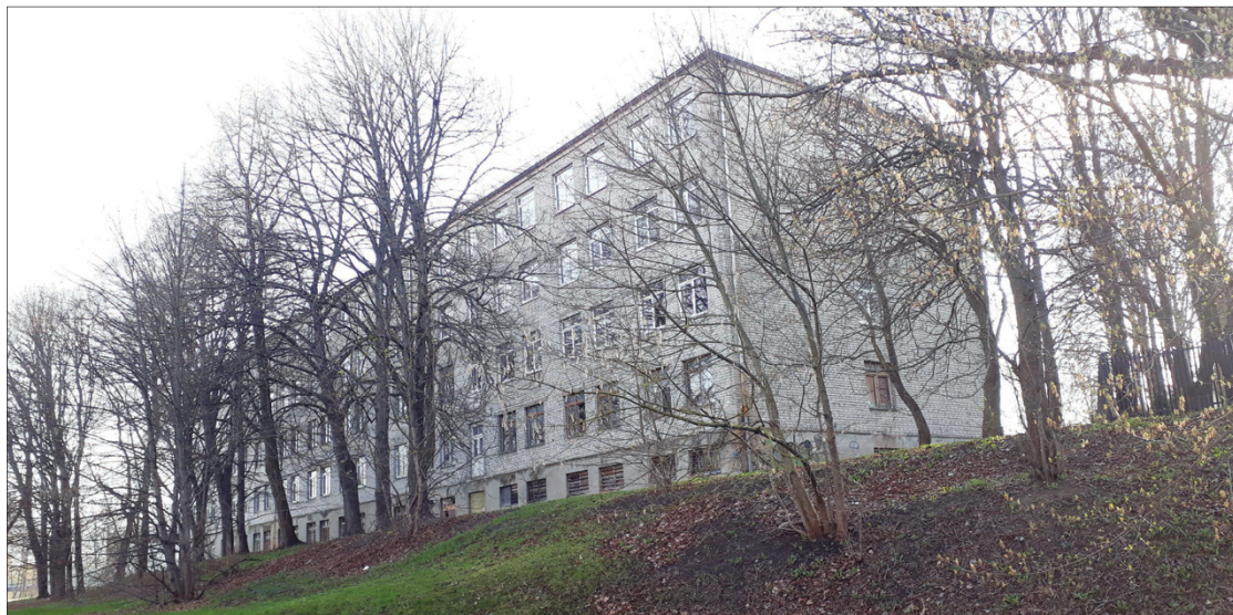
Buvusį mokyklos-internato pastatą pašešupyje (prie Marijonų gimnazijos) iš Turto banko nupirko privatus investuotojas. Jis čia iki 2032 -ųjų metų įrengs gyvenamąsias patalpas. Dabar daugiabutis projektuojamas

Anot jo, butų Marijampolėje – tiek naujos, tiek senos statybos perka ir kauniečiai, nes jie čia gerokai pigesni nei Laikinojoje sostinėje, o pasiekti darbo vietą Kaune trunka mažiau nei valandą.