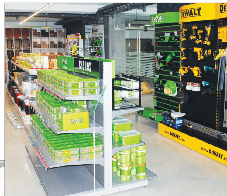
Viskas, ko reikia stogams dengti, fasadams įrengti