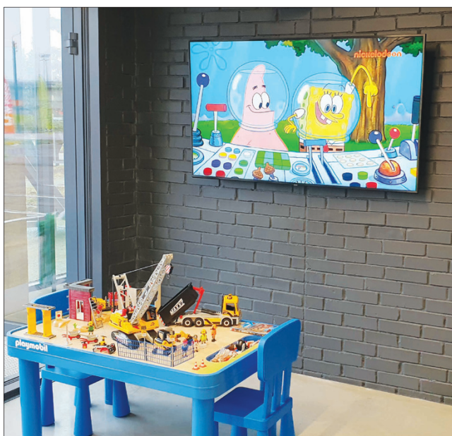
Vaikų kampelis laukia karantino pabaigos