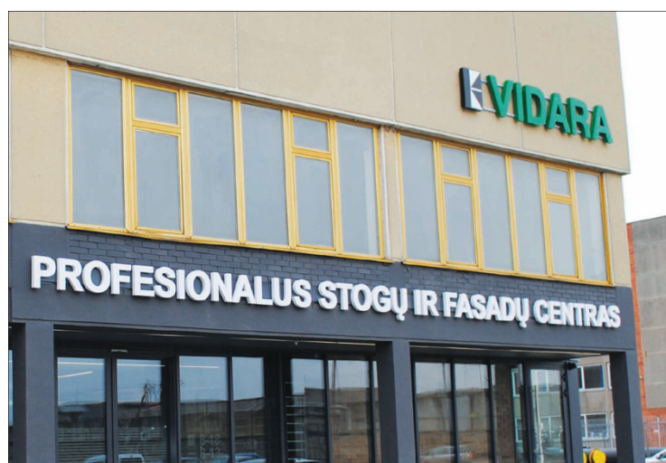
Salonas įsikūrė buvusiose Putliųjų verpalų fabriko patalpose

UAB „Vidara“ salonas Soties g. 14 dirba: I-V nuo 8 val. iki 18 val., VI nuo 8 val. iki 13 val. VII nedirba