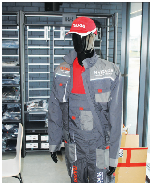
Tokį aprangos komplektą „Vidara“ dovanoja su įmone bendradarbiaujantiems stogdengiams