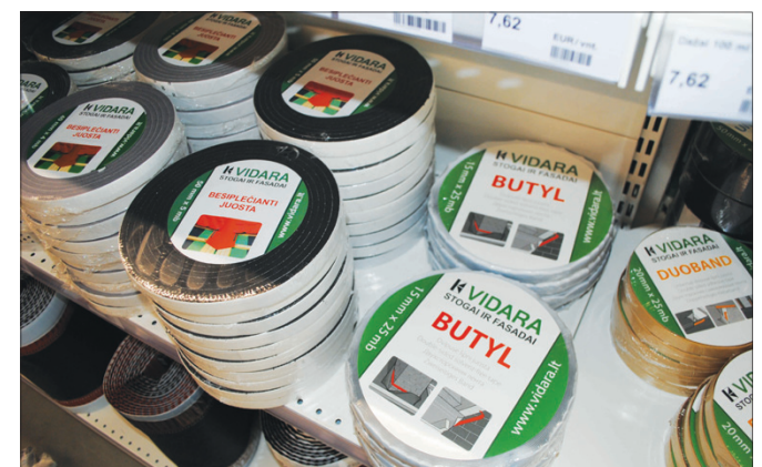
Produkcija iš gamyklų atkeliauja su Marijampolės įmonės prekiniu ženklu