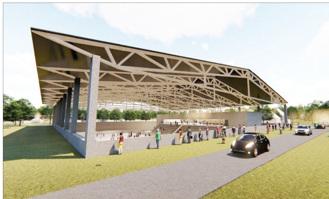
Panašią areną ketinama statyti Alytuje

Teirautis tel.: 8 604 24 268, 8 606 93 229.