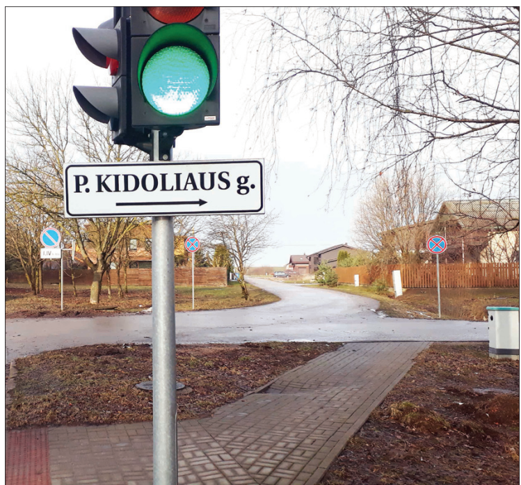
Informacinė lentelė klaidina, nurodytą gatvę matote beveik tiesiai už šviesoforo

į SSSR, antrasis aktyviai bendradarbiavo su sovietais ir kartu su poete, parašiusia Staliną šlovinančią poemą, vyko į Maskvą prašyti, kad Lietuva būtų „priimta“ į Sovietų Sąjungos sudėtį?