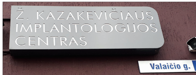
O įstaigos pavadinime pirma vardo raidė įrašyta...

Nuorodą į A. Yliaus gatvę randu, tačiau jos tik keletas metrų -toliau laukai. Gal kada nors ten