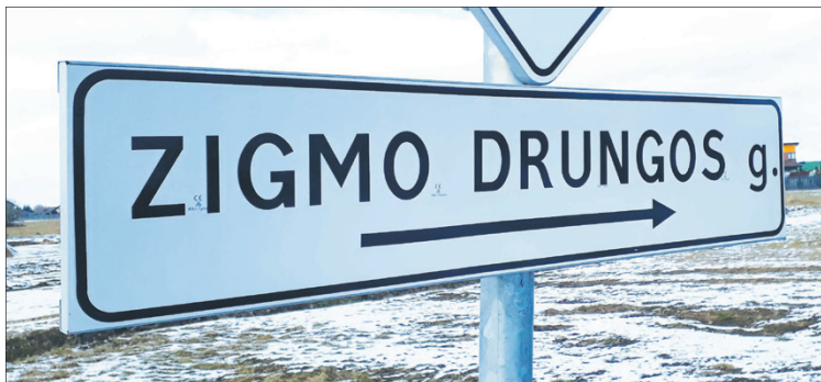
Naujuosiuose Tarpučiuose Z. Drungos gatvė ne tik bevardė