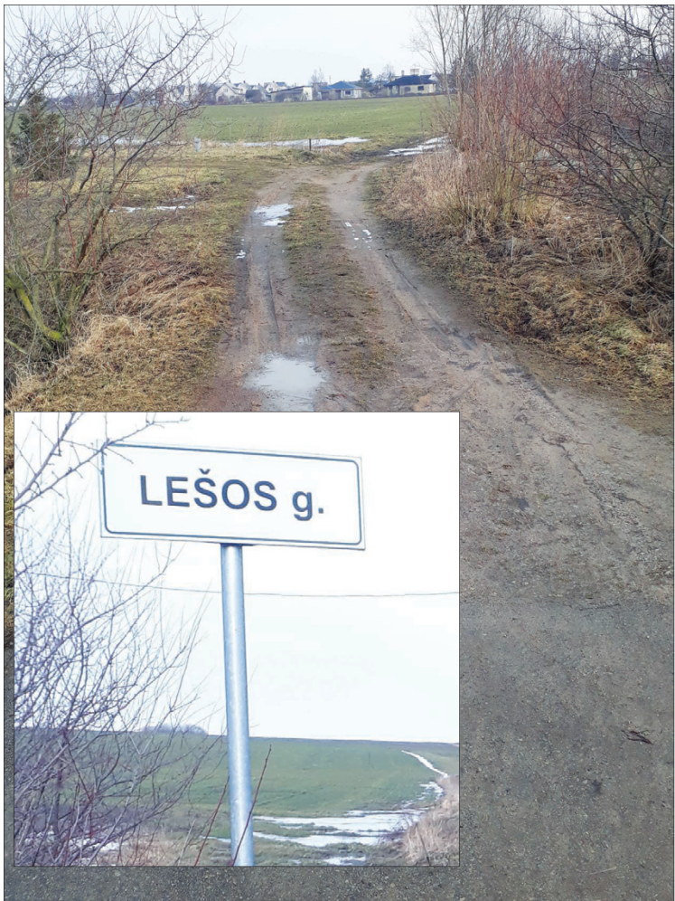
Gal tikimasis, kad norvegai išsalfatuos?