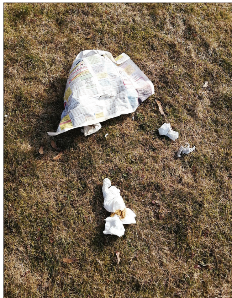
Varnos jau pasidarbuo

Gal kas perskaitys šitą tekstą ir patars, kaip mums toliau gyventi.