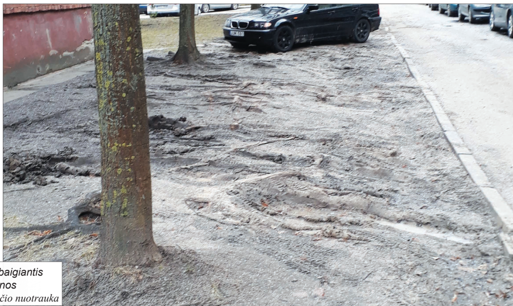
Rytą čia tik vienas kitas automobilis, o baigiantis darbo dienai visą plotelį padengia mašinos