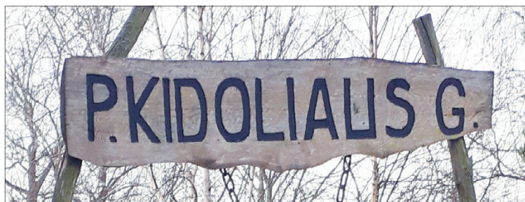
Vienintelė informacinė lentelė visoje gatvėje

O kam turėtų rūpėti informacinės lentelės su P. Cvirkos, L. Giros, S. Nėries pavardėmis? Kuo šie žmonės nusipelnė, kad Lietuvai tik ką paminėjus 31-ąsias nepriklausomybės atkūrimo metines, Marijampolėje tebėra jų gatvės? Gal tuo, kad pirmasis 1940-aisiais metais, būdamas vadinamojo Liaudies Seimo sekretoriumi, pasirašė sovietų okupaciją įtvirtinančią deklaraciją dėl įsijungimo