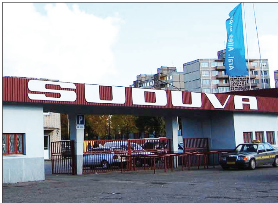
„Sūduvos“ stadionas nuo 1970-ųjų vasaros (vėliausiai)