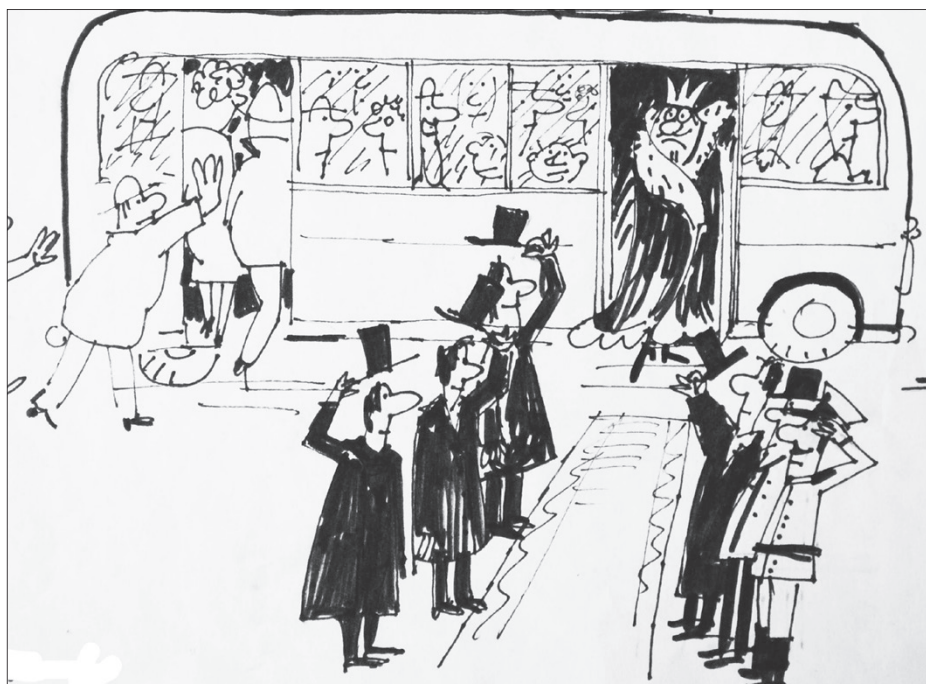
Andrius nuo 2020-ųjų vasaros