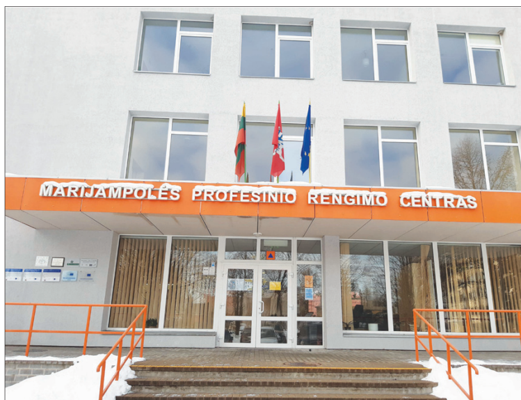
Šio pastato stogo konstrukcija puikiai tiko įrengti saulės elektrines

Artimiausiuose planuose numatomas tęstinis Marijampolės PRC modernizavimas atsižvelgiant į ekologiškesnį išteklių vartojimą. Įstaiga numato įsigyti mažiau taršios praktinio mokymo įrangos ir technikos bei mokomojo transporto, kuris naudoja elektros energiją.