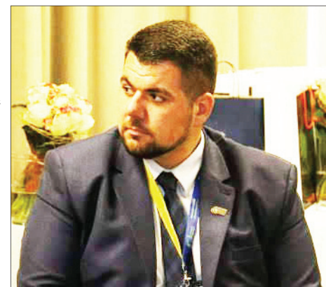
G. Juodišius džiaugiasi, kad jo vadovaujama įstaiga gamina aplinką tausojančią energiją

Po ilgų diskusijų Marijampolės PRC įsigijo dvi saulės elektrines –