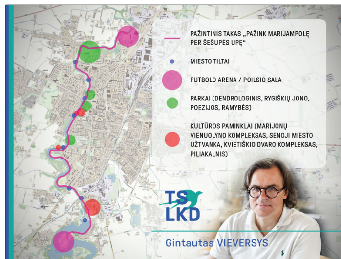
Pažintinio tako „Pažink Marijampolę per Šešupės upę“ schema

kapus. Takas kirstų 8 tiltus, įskaitant ir perspektyvoje esantį Aušros tiltą. Šis išpūdingas takas pasibaigtų poilsio zonoje, kurioje šiuo metu yra „Wake“ parkas. Taip būtų apjungiami du skirtingi miesto poliai - šiaurinis ir pietinis.