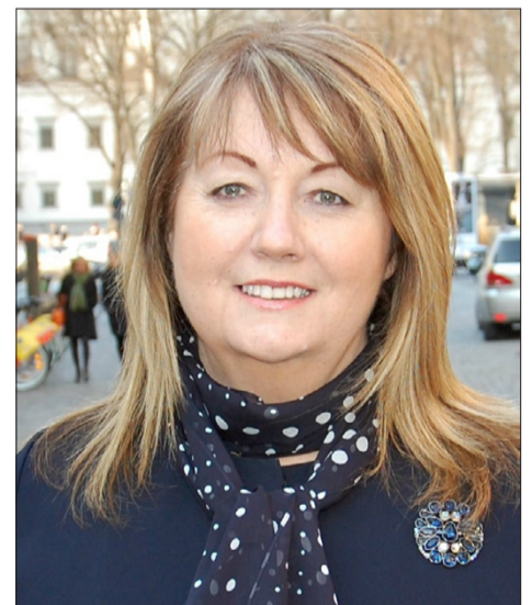
Vilija Blinkevičiūtė: „Ekonomikos nuosmukio laikotarpiams (kaip ir šiuo metu) minimalaus darbo užmokesčio reikšmė tampa dar svarbesnė.“

Deja, bet Lietuvoje kolektyvinėse derybose atstovaujama vos 8 procentai dirbančiųjų. Todėl sunku įgyvendinti Darbo kodekse numatytą