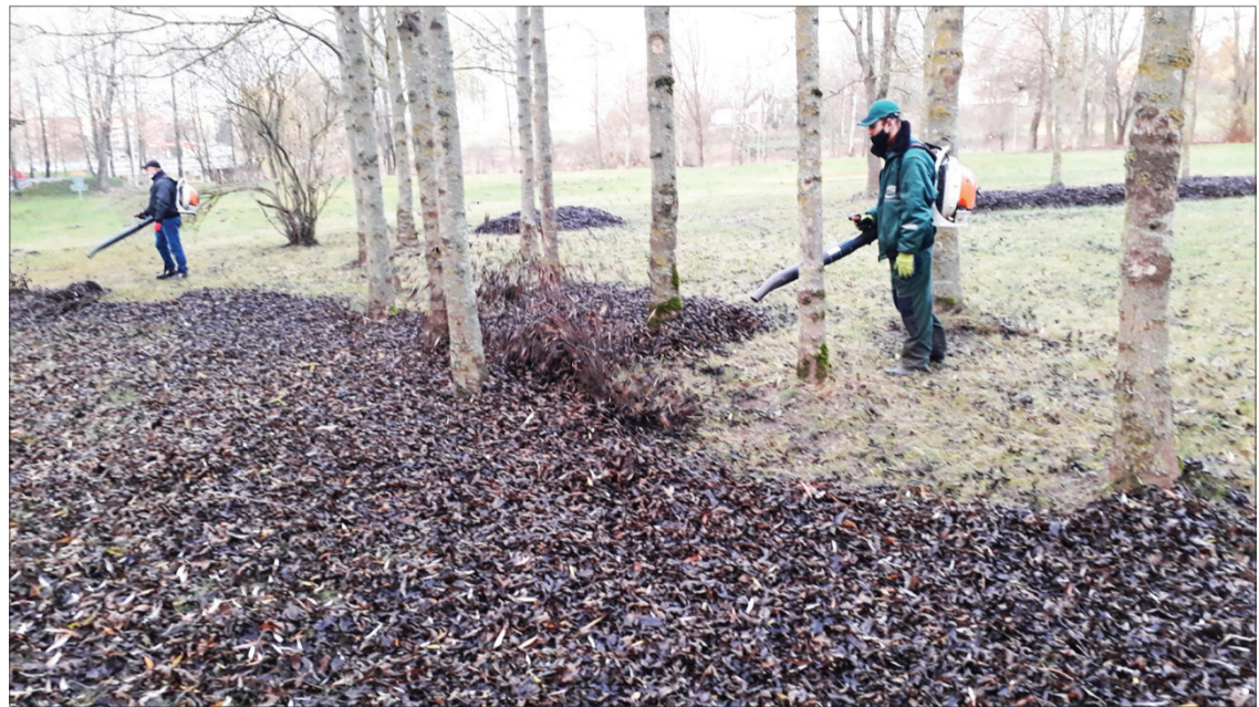
Pašėšupio parke lapai pūstuvais „ginami“ į krūvas, o po to specialia įranga susiurbiami į talpas ir vežami kompostuoti

„Jei negrėbtais lapais mistų pūkuotos, gražios, juokingos pandos, tai, manau, lapus negrėbiančių būtų žymiai daugiau nei kad dabar, – sako A. Pivoras. – Nes šimtąkojis juk ne toks mielas... Bet galbūt ir jiems turėtume suteikti galimybę gyventi? Galbūt bent tam tikrose vietose?“