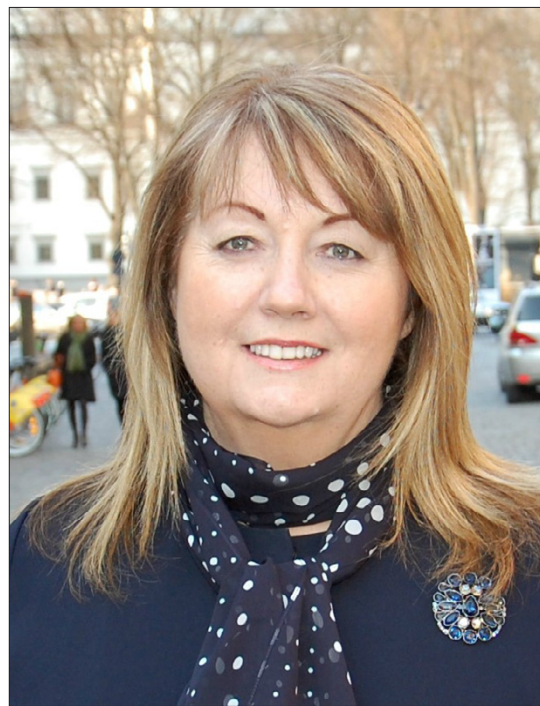
Vilija Blinkevičiūtė: „Gera, kad ES ir dauguma valstybių pasimokė iš 2008 metų krizės klaidų“

- Tai didžiulė suma, jei ji bus investuota į žmones. Ir ne milijarduose esmė, o kaip jie bus panaudoti. Neabejoju, kad nemaža dalis tų lėšų, kurios papildomai ateis į