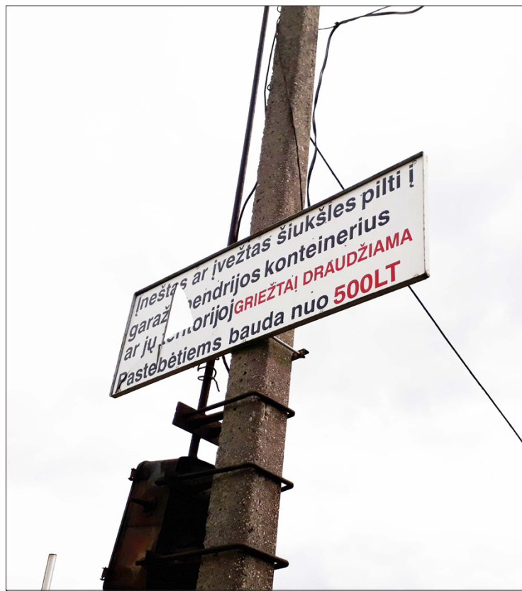
Stendas prie įvažiavimo į bendrijos teritoriją ne tik perspėja, bet ir primena Lietuvą turėjus nacionalinę valiutą

O kur dar autentiška sovietinių laikų išvietė, pasitinkanti ateinant nuo Vasaros gatvės pusės, kita egzotika, įskaitant privatų WC nuo Sasnavos g. (nuotraukos 1 psl.). Apleistus garažus pritaikius prekybai ir visuomeniniam maitinimui, muziejaus po atviru dangumi lankytojai apsirūpintų suvenyrais su Marijampolės atributika, skanautų Suvalkijos tautiškais tapusiu patiekalų: kebabų, kibinų, picų. Niūresniuose garažuose galima įrengti motelius – juk