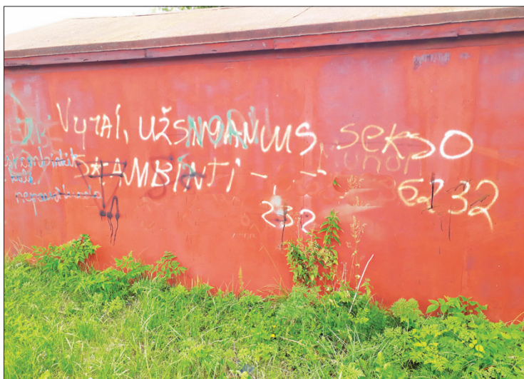
Sprendžiant iš to, kad Tarybų sąjungoje sekso nebuvo, užrašas darytas Marijampolėi jau atgavus istorinį vardą