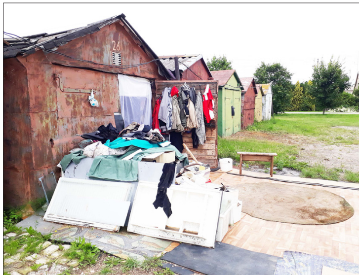
Inventorizacija, arba kas namelyje gyvena?