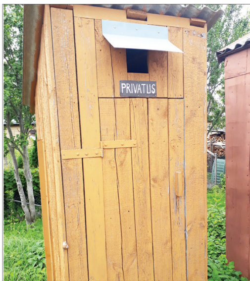
Čia, suprantama, ne garažai, o jų priedėliai: kairėje - skardinis sovietinių laikų WC, kitas statytas atgavus nepriklausomybę

Vytautas ŽEMAITIS. Po karantino mieste pasirodė turistų. Jie lanko įvairiausias žiniasklaidos kanalais reklamuojamus gražiausią Lietuvoje (skonio reikalas) Poezijos parką, Kačių kiemėlį, gėrįsi sienų piešiniams ar Jono Basanavičiaus aikšte su paminklu toms, kurios nemirė ir, tikėtina, gyvuos dar ne vieną šimtmetį*.