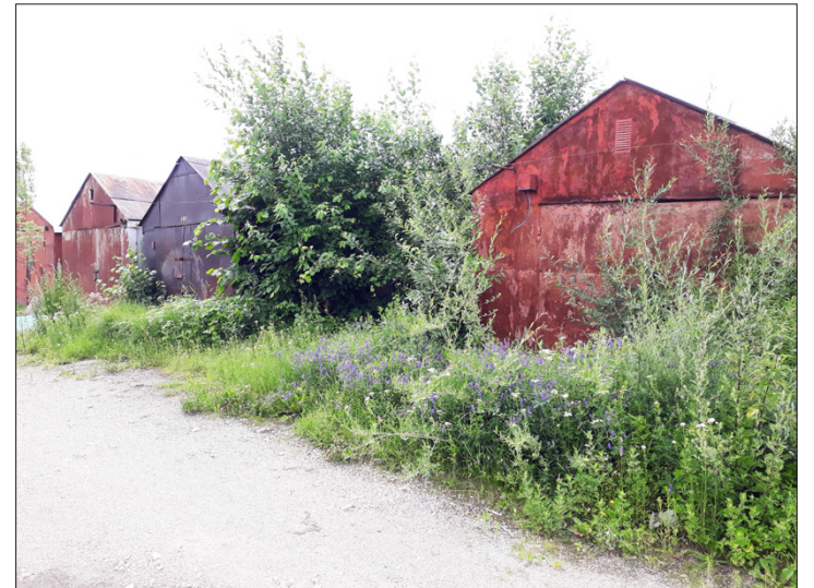
o šie palikti likimo valiai

iškilti žmonė ar gyvenamieji namai, mat žemė pažliugusi, o melioracijai reikėtų daug papildomų išlaidų.