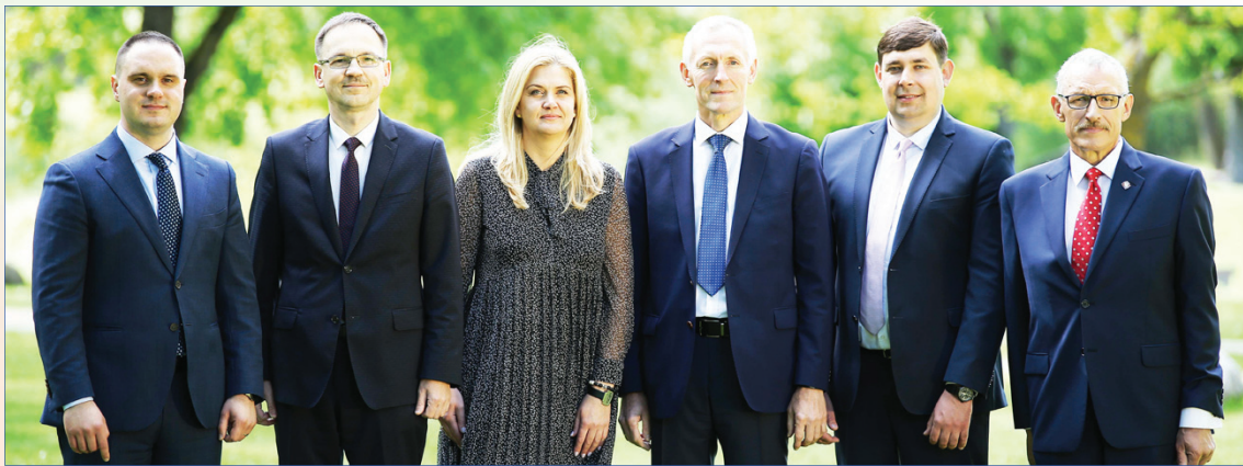
Marijampolės savivaldybės tarybos Tėvynės sąjungos - Lietuvos krikščionių demokratų frakcija

prieš daugiau nei septynis šimtus metų Europoje suskambėjo Lietuvos valstybės vardas - tarp girių ir ežerų gimė Mindaugo Lietuva. Šiandien Lietuva tęsiasi kiekviename iš mūsų. Tad, minėdami Liepos 6-ąją, neužmirškime svarbiausių tautos ir valstybės egzistavimo sąlygų, nepaskęskime tarp vienadienių smulkmenų ir laikinų sunkumų, o susitelkime ir auginkime stiprią, klestinčią Lietuvą. Niekada nepamirškime, kad čia - mūsų žemė, mūsų dvasinės šaknys, mūsų valstybė. Ji bus tokia, kokią sukursime savo darbais. Dalykimės sveikinimais, linkėjimais ir gera vasariška nuotaika su kiekvienu, kuriam brangi Lietuva, jos istorija ir ateitis. Su Valstybės diena!