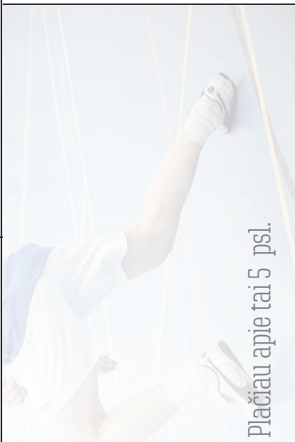
Plačiau apie tai 5 psl.