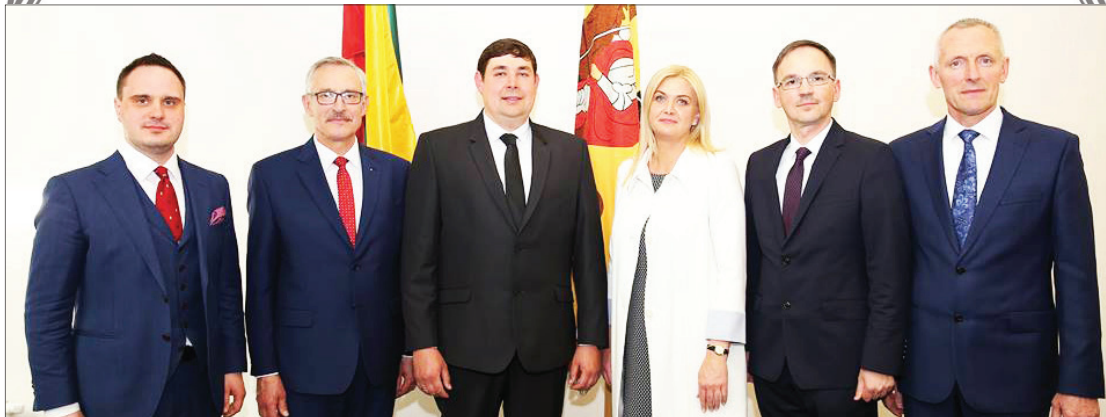
Marijampolės savivaldybės tarybos Tėvynės sąjungos – Lietuvos krikščionių demokratų frakcija

Linkime kantrybės, sveikatos ir Dievo palaimos!