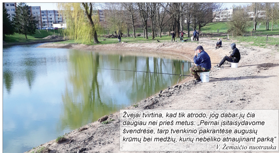
Žvejai tvirtina, kad tik atrodo, jog dabar jų čia daugiau nei prieš metus: „Pernai įsitaisydavome švendrėse, tarp tvenkinio pakrantėse augusių krūmų bei medžių, kurių nebeliko atnaujinant parką“

„O kas ten laukia, - vėl kalba Petras. – Matėte, koks ten vandens lygis? Mažai kas iš čia žūklaujančių prisimena Šešupę buvus tokią seklią.“