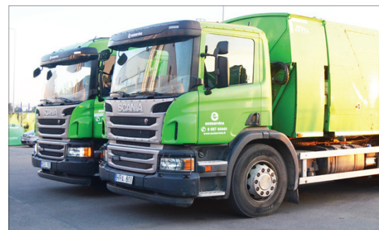
Jau įpratome matyti šiukšliavežes su „Ecoservice“ ženklų

Prie jūsų paminėtų įmonių reikia pridėti kino teatrą, televiziją, nes, atrodo, nė vienoje savivaldybėje nėra tokio „valdiško“ verslo, visur privatus. Pritariu ir siūlysiu viešai parduoti dar daugiau savivaldybės įmonių, nepaliekant užribyje ir viešųjų įstaigų. Kai kurios jų taip pat gali būti parduotos.